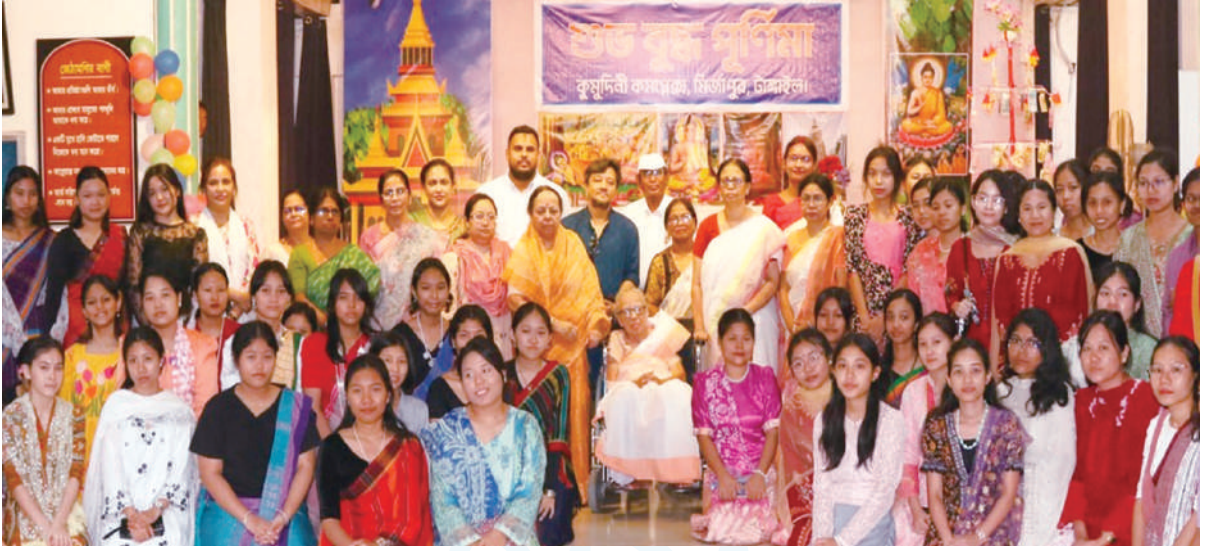
Buddha Purnima celebration at PPM Hall, Bharateswari Homes.