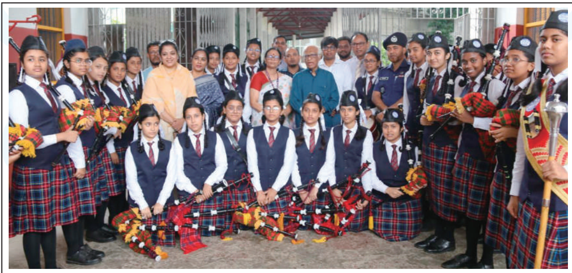
Dr Wahiduddin Mahmud, Adviser, Ministry of Planning with the members of Pipe Band, Bharateswari Homes.