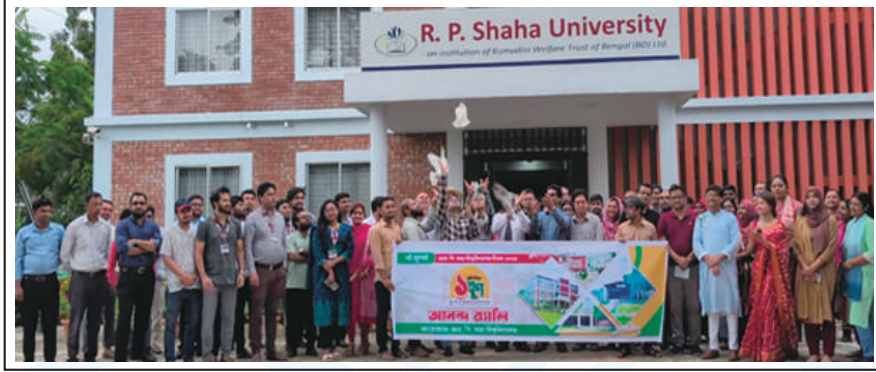
On the founding day of RPSU students, teachers and employees brought out a rally on the Campus.