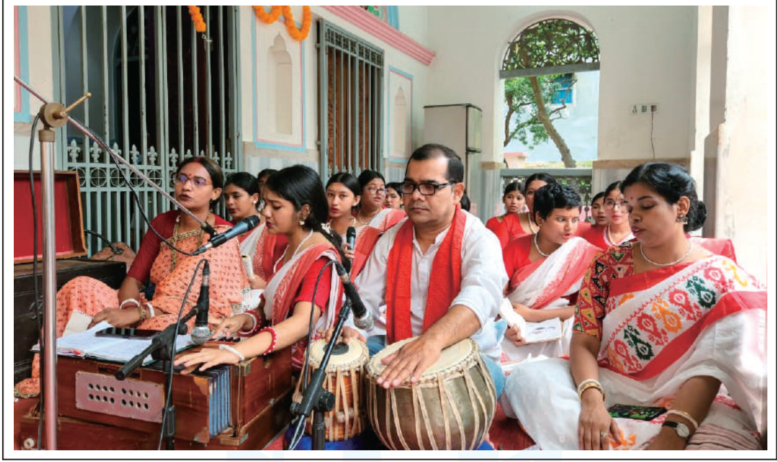
Artists from Bharateswari Homes and Kumudini Nursing College, Mirzapur perform devotional songs at the temple.