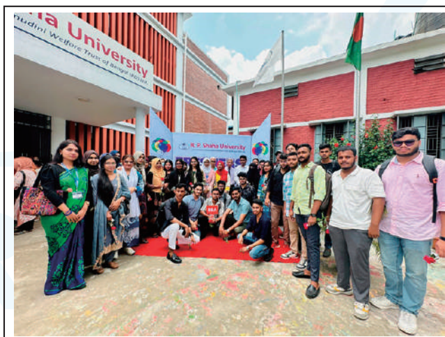
The green campus of RPSU became vibrant with arrival of the students for the Fall-2025 semester.