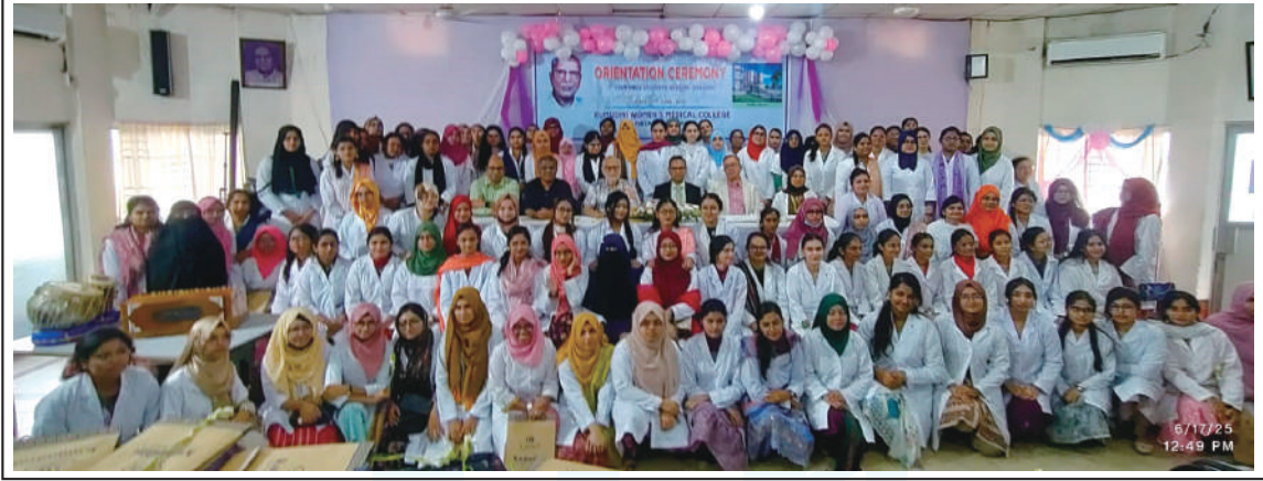
Group photo of new Bangladeshi and foreign MBBS students.

National anthem was performed on both occasions at the end. ●