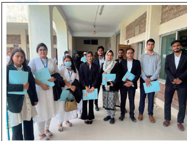
Students of 22 and 23 Batches of Law and Human Rights Dept attended a motivational seminar on government legal aid activities held at Narayanganj on June 24, 2025.