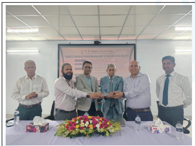
"Campus to Corporate: Navigating Your Path to a Multinational Career" - a seminar focusing on essential skills for career success held on May 18, 2025 at RPSU. This was organized by School of Business of the University.