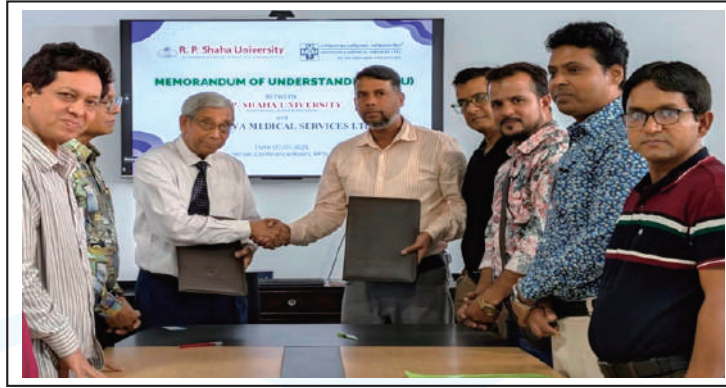
Representatives of RPSU and Medinova at the MoU signing ceremony.