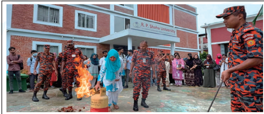
A student is being trained at the Fire Service and Civil Defense Training programme.