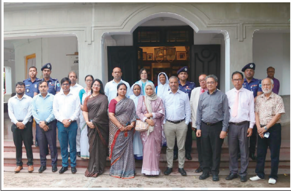
Dr Asif Nazrul, Adviser of Law, Justice & Parliamentary Affairs with the officials of Tangail District Administration and Kumudini Welfare Trust.

পরিদর্শনকালে পরিকল্পনা উপদেষ্টা বলেন, ১৯৩৮ সাল থেকে কুমুদিনী নারীশিক্ষা, স্বাস্থ্যসেবা ও নারীদের উন্নয়নে অত্যন্ত সুনামের সাথে অবিরাম কাজ করে যাচ্ছে। তিনি ট্রাস্টের প্রতিষ্ঠাতা রণদা প্রসাদ সাহা-র অবদানের কথা শ্রদ্ধাভরে স্মরণ করে এই প্রতিষ্ঠানের সকল কার্যক্রমের ভূয়সী প্রশংসা করেন এবং এর উত্তরোত্তর সমৃদ্ধি কামনা করেন।