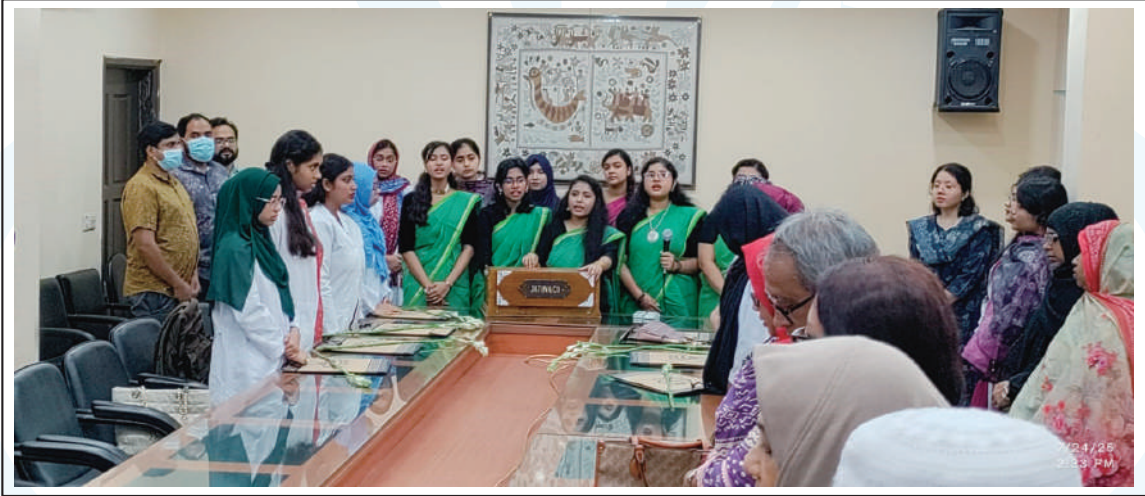
BDS students performing songs at the orientation programme.