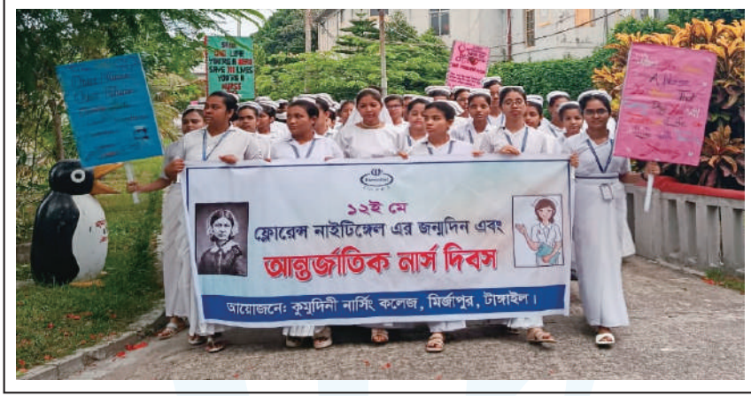
A rally on the occasion of International Nurses Day.

করেন। প্রভাতফেরি শেষে কুমুদিনী হাসপাতালের সবাই একত্রিত হয়ে ফ্লোরেন্স নাইটিঙ্গেলের শপথবাক্য পাঠ করেন। তারা কঠে কঠে মিলিয়ে 'আমি এক সেবিকা, সেবাই তো আমার ধর্ম' এই গানটি পরিবেশন করেন। সকাল ন'টায় কমপ্লেক্সের আনন্দ নিকেতনে অনুষ্ঠিত হয় মনোজ্ঞ একটি সাংস্কৃতিক অনুষ্ঠান। অনুষ্ঠান শেষে কেক কাটার মধ্য দিয়ে সম্পন্ন হয় নাইটিঙ্গেলের শুভ জন্মদিনের স্মারক 'আন্তর্জাতিক নার্সেস ডে' উদ্‌যাপন। ●