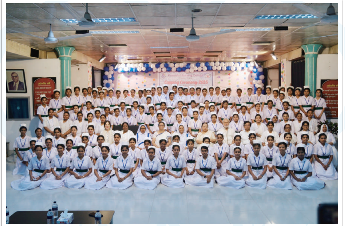
Nursing students qualified for hospital duty participated at the ceremony.

Finally, the students performed music and dances adding a joyful touch to the ceremony. ●