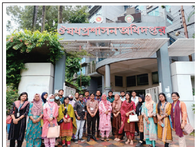
A group of 25 students and faculties from Pharmacy Dept visited the Directorate General of Drug Administration in Dhaka on July 24, 2025. The visit aimed at understanding of national drug regulation, quality control and pharmaceutical safety.