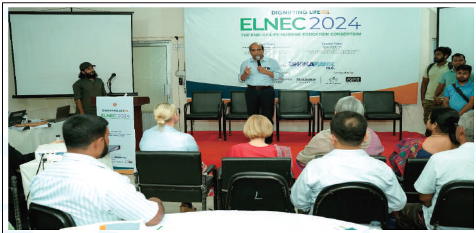
A specialist from the USA is seen conducting a class in the 4-day long ELNEC training programme.

কুমুদিনী ওয়েলফেয়ার ট্রাস্ট ও আয়াত ফাউন্ডেশনের যৌথ উদ্যোগে মির্জাপুরস্থ কুমুদিনী কমপ্লেক্সে চার দিনের ELNEC বা End-of-Life Nursing Education Consortium প্রশিক্ষণ অনুষ্ঠিত হয়।