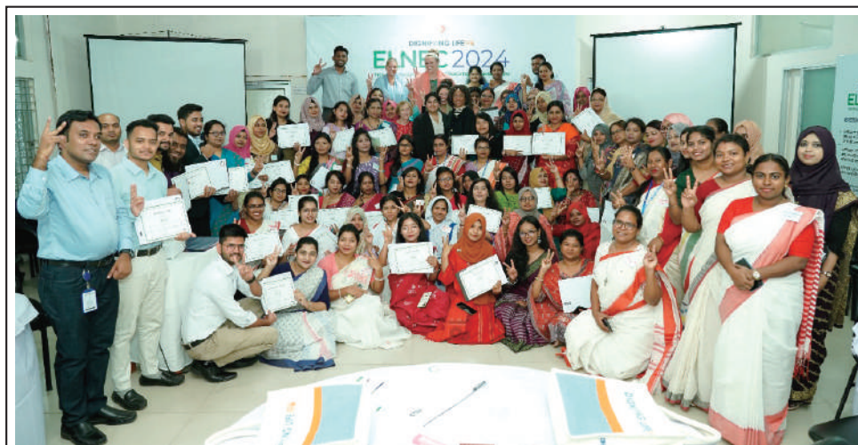
Trainees from the Govt and private institutions after successful completion of ELNEC training.

Specialist trainers from the USA conduct training on 8 modules related to serious illness. The subjects included Palliative Care, Pain Assessment and Management, Ethical and Legal Issues, Cultural and Spiritual Considerations, Grief and Bereavement etc.