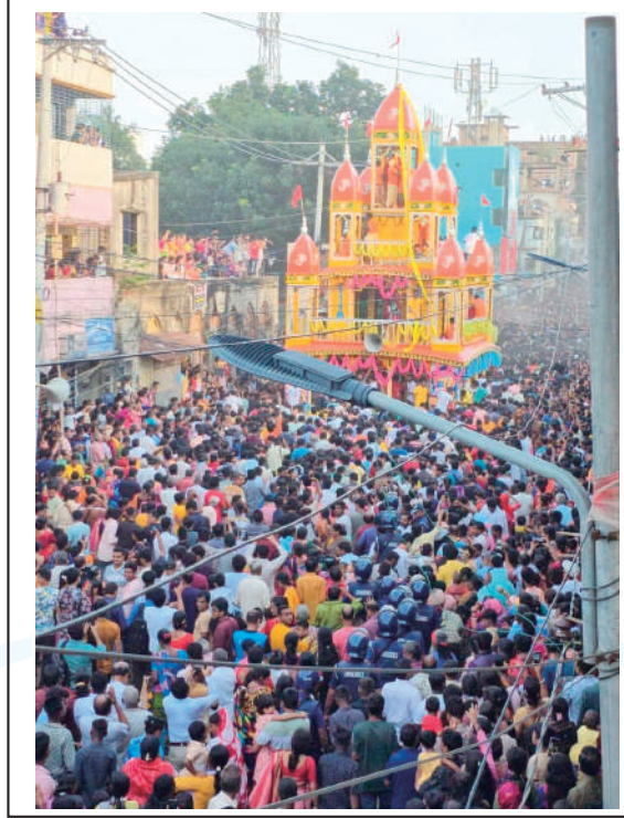
Celebration of Rath Yatra at Dhamrai.

ইতিপূর্বে বালিয়াটির জমিদারগণ স্থানীয় ভক্তবৃন্দের সহযোগিতায় ধামরাইর রথোৎসবের তত্ত্বাবধান করতেন। জমিদারি প্রথা বিলুপ্তির পর রায় বাহাদুর রণদা প্রসাদ সাহা এই রথের দেখভাল করতেন। অদ্যাবধি তাঁর প্রতিষ্ঠিত কুমুদিনী ওয়েলফেয়ার ট্রাস্ট ও কুমুদিনী পরিবারের সদস্যগণ এই রথের দেখভাল করছেন। ●