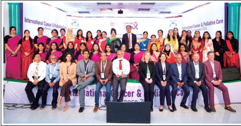
Participants: International Cancer & Palliative Care Conference 2024.