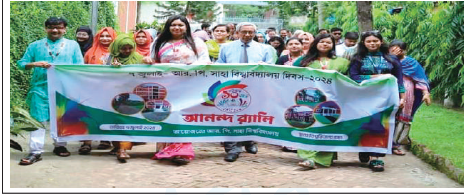
A rally brought out by the students, teachers and staff to mark the foundation day of RPSU.

৭ই জুলাই উদযাপিত হল বিশ্ববিদ্যালয়ের ১১তম প্রতিষ্ঠা দিবস।