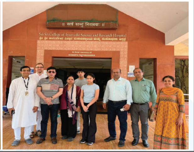
A team from Kumudini Welfare Trust recently visited IPM and two other institutions in the Indian state of Kerala: (L) Community Palliative Care Society and (R) Sri Sri College of Ayurvedic Science and Research Hospital.