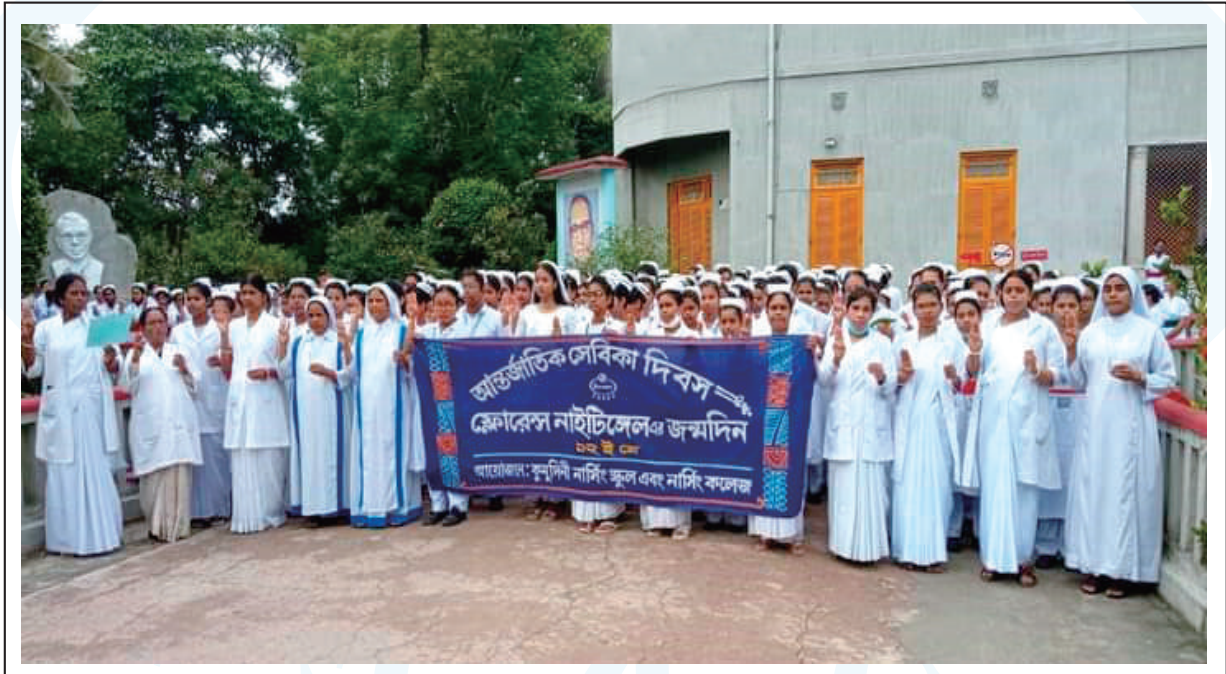
A colourful rally brought out by the teachers and students of Kumudini Nursing School & College to mark the Int'l Nursing Day.

Among the other programmes of the day were a cultural show participated by the teachers & students. Cutting cakes at Ananda Niketan in the Complex was part of the ceremony. ●