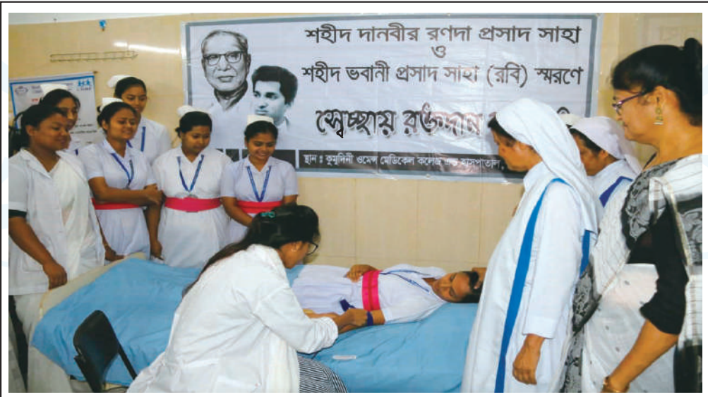
Voluntary blood donation at Kumudini Women's Medical College and Hospital.

On this occasion, a luncheon was organized for around 10,000 people at the premises of Shaheed R P Shaha's village home. People from various professions and classes of the society participated. Earlier, voluntary blood donation programme was arranged and served special food among the patients of the hospital. ●