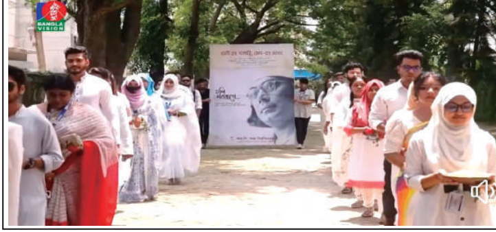
Observing 125 th birth anniversary of our National Poet Kazi Nazrul Islam.

বিশ্ববিদ্যালয়ে জাতীয় কবি কাজী নজরুল ইসলামের ১২৫তম জন্মজয়ন্তিতে এক র্যালির আয়োজন করা হয়। সকল শিক্ষার্থী সমন্বয়ে র্যালিটি বিশ্ববিদ্যালয়ের প্রশাসনিক ভবন থেকে শুরু হয়ে একাডেমিক ভবনে শেষ হয়। এরপর এক মনোজ্ঞ সাংস্কৃতিক অনুষ্ঠানের মধ্য দিয়ে অনুষ্ঠানের সমাপ্তি হয়। ●