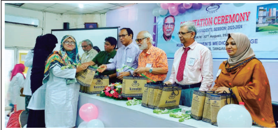
Orientation ceremony for BDS.