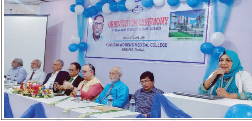
Orientation ceremony for MBBS.

Orientation Ceremony for MBBS and BDS Students of Session 2023-24