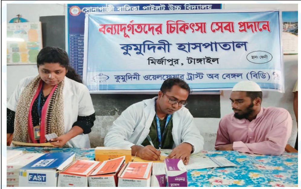
Medical teams from Kumudini Hospital attending victims of the recent floods in greater Noakhali areas.

গত ২৭-৩০শে আগস্ট পর্যন্ত কুমুদিনী হাসপাতালের ৮ সদস্যের একটি মেডিকেল টিম ফেনী জেলার সিভিল সার্জন অফিসের সঙ্গে সমন্বয় করে সোনাগাজী, কাজির হাট ও সোনপুর উপজেলায় বন্যাদুর্গতদের মাঝে বিনামূল্যে চিকিৎসা সেবা প্রদানসহ রোগীদের ওষুধ সরবরাহ করেন। টিমের সদস্যগণ প্রায় ২০০০ বন্যাদুর্গত রোগীকে চিকিৎসা সেবা দিয়েছেন।