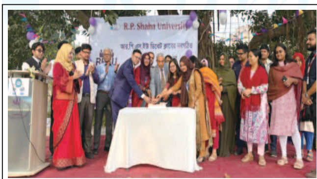
Official inauguration of RPSU Debate Club Executive Committee. - 9 Dec 2024