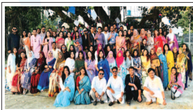
Dept of English organized a programme titled Heem Bilash-1431 at Bottala in the Campus to welcome the Winter season. - 3 Dec 2024