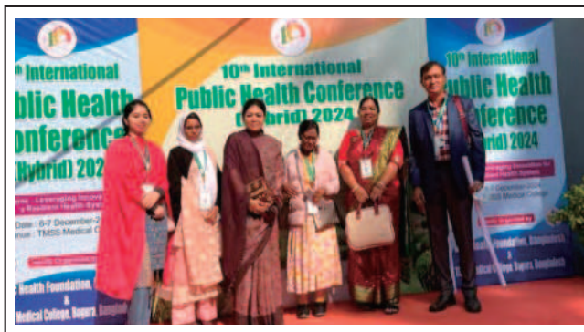
MPH students attended 10 th International Public Health Conference 2024 at Bogura organized by Public Health Foundation Bangladesh & TMMS Medical College, Bogura. - 6-7 Dec 2024