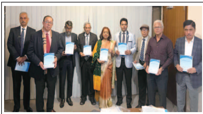
9 th Syndicate Meeting of R.P. Shaha University. - 17 Dec 2024