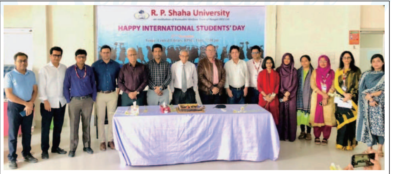
Celebration of International Students' Day.