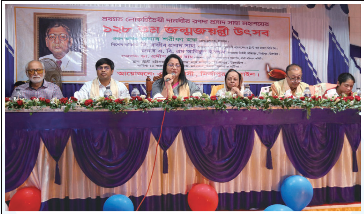
Discussion meeting and cultural programme held at the ancestral home of philanthropist Shaheed R P Shaha on the occasion of his 128 th birthday anniversary.

128 th Birth Anniversary of Philanthropist Shaheed R P Shaha Celebrated