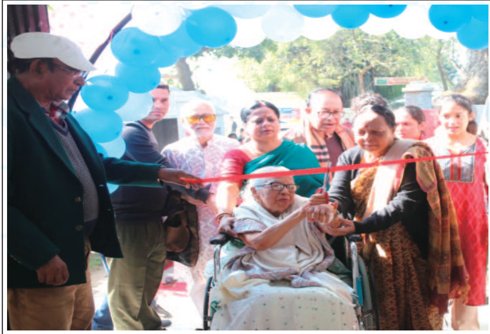
Opening ceremony of Kumudini's new Cafeteria at Kumudini Complex, Mirzapur.