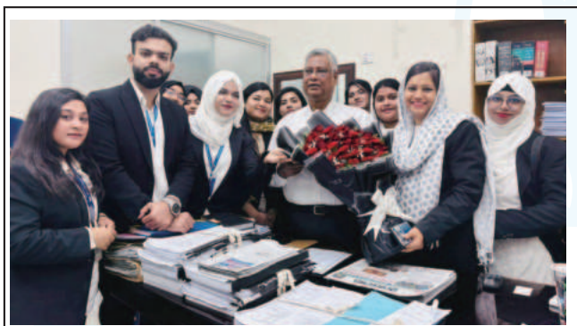
Students of Law visited the Supreme Court of Bangladesh organized by the Dept of Law and Human Rights of RPSU.