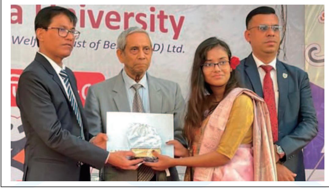
GPA 5 recipient in the last HSC Exam receiving Certificate and Crest from the university authority.

২৩শে নভেম্বর ২০২৪ সালে নারায়ণগঞ্জ জেলার বিভিন্ন কলেজের জিপিএ ৫ প্রাপ্ত প্রায় পাঁচশ' শিক্ষার্থীকে বিশ্ববিদ্যালয়ের উদ্যোগে সংবর্ধনা দেয়া হয়। অনুষ্ঠানে বিভিন্ন কলেজ থেকে উত্তীর্ণ হওয়া মেধাবী শিক্ষার্থীরা বিশ্ববিদ্যালয়ের সবুজ ক্যাম্পাসে উপস্থিত হয়ে আনন্দ ও খুশিতে মেতে ওঠেন। তাদের প্রাণবন্ত উপস্থিতি ও উচ্ছ্বাসে পুরো ক্যাম্পাস উৎসবমুখর হয়। সংবর্ধিত শিক্ষার্থীরা এই আয়োজনে তাদের মুগ্ধতার অনুভূতি ব্যক্ত করেন। উপস্থিত শিক্ষার্থীদের প্রত্যেককে বিশ্ববিদ্যালয়ের সনদপত্র ও ক্রেস্ট প্রদান করা হয়।