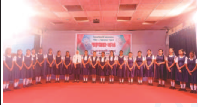
Paying homage to the memory of July Revolution Martyrs.

জুলাই-আগস্ট: ২০২৪ এর অভ্যুত্থানে শহীদদের স্মরণে ৩০শে নভেম্বর ভারতেশ্বরী হোমসের পিপিএম হলে এক আলোচনা সভা ও সাংস্কৃতিক অনুষ্ঠানের আয়োজন করা হয়।