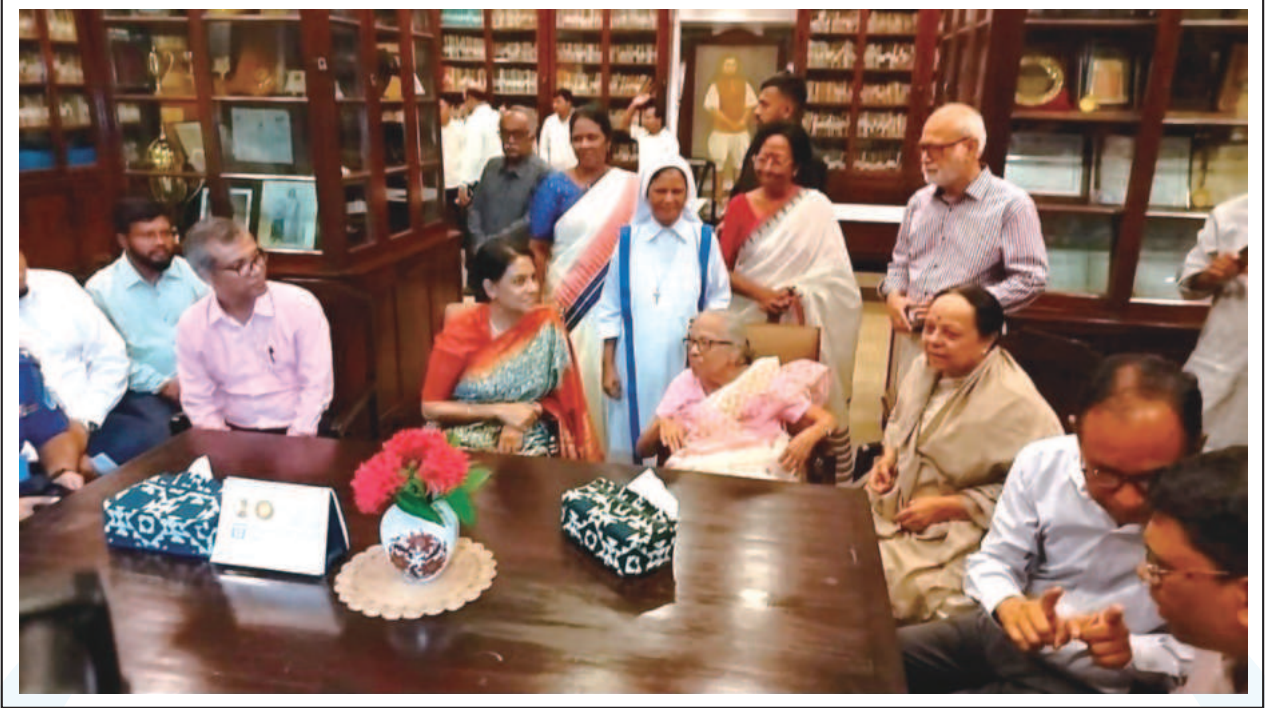
Syeda Rizwana Hasan, Adviser for Environment, Forest and Climate Change on a visit to Kumudini.

পরিবেশ, বন ও জলবায়ু পরিবর্তন মন্ত্রণালয় এবং পানি সম্পদ মন্ত্রণালয়ের উপদেষ্টা সৈয়দা রিজওয়ানা হাসান গত ৬ই নভেম্বর মির্জাপুরে অবস্থিত কুমুদিনী ওয়েলফেয়ার ট্রাস্ট পরিদর্শন করেন।