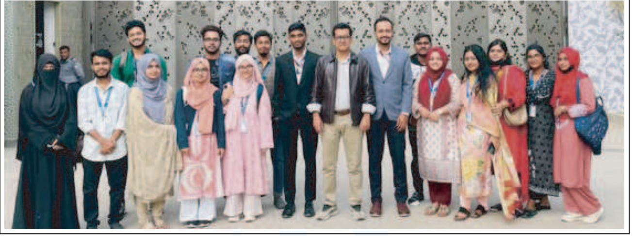
Students visiting M.S. Dyeing, Printing & Finishing Ltd at Fatullah in Narayanganj.