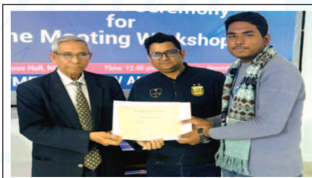
Certification Ceremony for the Mooting Workshop hosted by the Dept of Law & Human Rights. - 22 Dec 2024