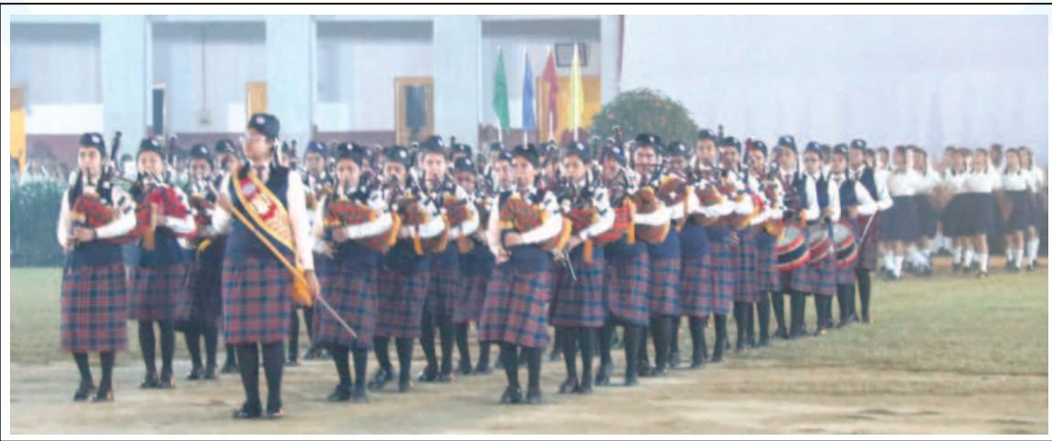
Bharateswari Homes Pipe Band team performing on the birthday of founder of KWT.

Besides, different programmes were celebrated in memory of the day at Kumudini Medical College, Bhateswari Homes and R P Shaha University in Narayanganj (See RPSU News at page-10). ●