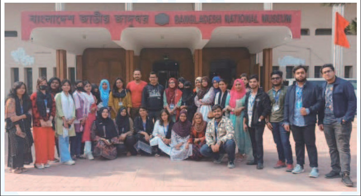
Students at the National Museum at Shahbagh in Dhaka.