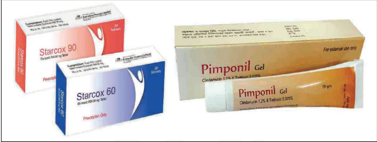
Starcox tablet to relieve pain