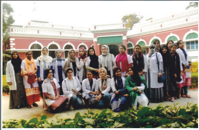
Students in front of the Kumudini Head Office during their visit in Narayanganj.

এমবিবিএস ছাত্রীদের জন্য রেসিডেন্টশিয়াল ফিল্ড সাইট ট্রেনিং (RFST), ‘ডে ভিজিট’ ও শিক্ষাসফর কার্যক্রম ঢাকা বিশ্ববিদ্যালয়ের কারিকুলামভুক্ত। উক্ত শিক্ষা কার্যক্রমে এই বছর কলেজে অধ্যয়নরতা ১১১ জন দেশি-বিদেশি ছাত্রী অংশগ্রহণ করেন। তাদের সার্বিক সহযোগিতায় ছিলেন কলেজের ৯ জন শিক্ষক-শিক্ষিকা এবং কয়েকজন স্টাফ।