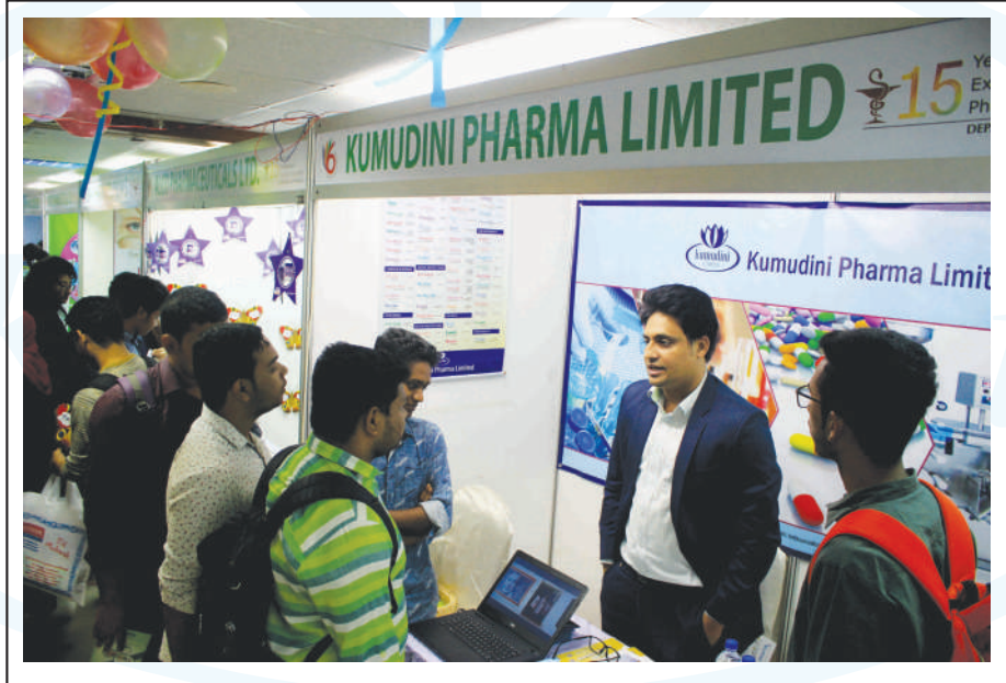
KPL in Career Fair

The participating firms expressed their interest in recruiting newly passed out graduates. KPL also expressed the same wishes. ●