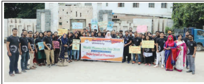
The Day was celebrated by the students and teachers of the Pharmacy Department.

ফার্মেসি বিভাগের শিক্ষক ও শিক্ষার্থীগণ দিবসব্যাপী কর্মসূচির আয়োজন করেন। কর্মসূচির মধ্যে অন্তর্ভুক্ত ছিল র‍্যালি, সেমিনার, মেডিক্যাল ক্যাম্পেইন এবং সাংস্কৃতিক অনুষ্ঠান।