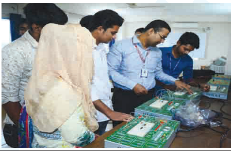
Students of EEE Department at Mechanical Workshop and Power Generation House of KWT as a part of their industrial visit.