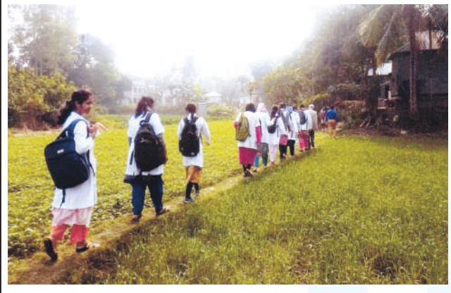
Visiting a village under Mirzapur Upazila for data collection in RFST programme.

নারায়ণগঞ্জ কুমুদিনী কমপ্লেক্সে অবস্থিত কুমুদিনী ফার্মা, গার্মেন্টস ফ্যাক্টরি ও জুট বেলিং ইন্ডাস্ট্রি, মধুপুর জলছত্রে অবস্থিত যক্ষ্মা ও কুষ্ঠ হাসপাতাল সরেজমিনে পরিদর্শন করেন। শিক্ষার্থীগণ উক্ত প্রতিষ্ঠানে কর্মরত চিকিৎসকদের সাথে মত বিনিময় করে বিভিন্ন সরকারি ও বেসরকারি স্বাস্থ্য প্রতিষ্ঠানের ব্যবস্থাপনা কার্যক্রম এবং কর্মীদের স্বাস্থ্য রক্ষা ও বর্জ্য ব্যবস্থাপনা বিষয়ে বাস্তব অভিজ্ঞতা অর্জন করেন।