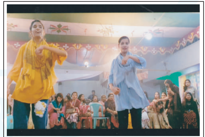
Cultural programme on the concluding day of the trip at Cox's Bazar.