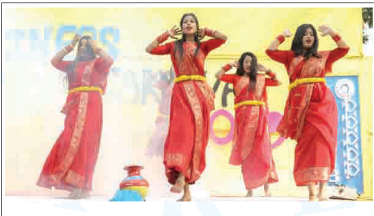
Cultural programme arranged at the Carnival to receive the freshers and to bid farewell to the outgoing students of Business Administration Department.