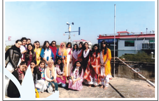
Students at Meteorological Centre at Cox's Bazar.

Immunization (EPI), Kumudini Pharma located at Narayanganj, Tuberculosis and Leprosy Hospital at Madhupur. The students gathered knowledge through discussion with the doctors, officers, employees and field staff of those organizations.