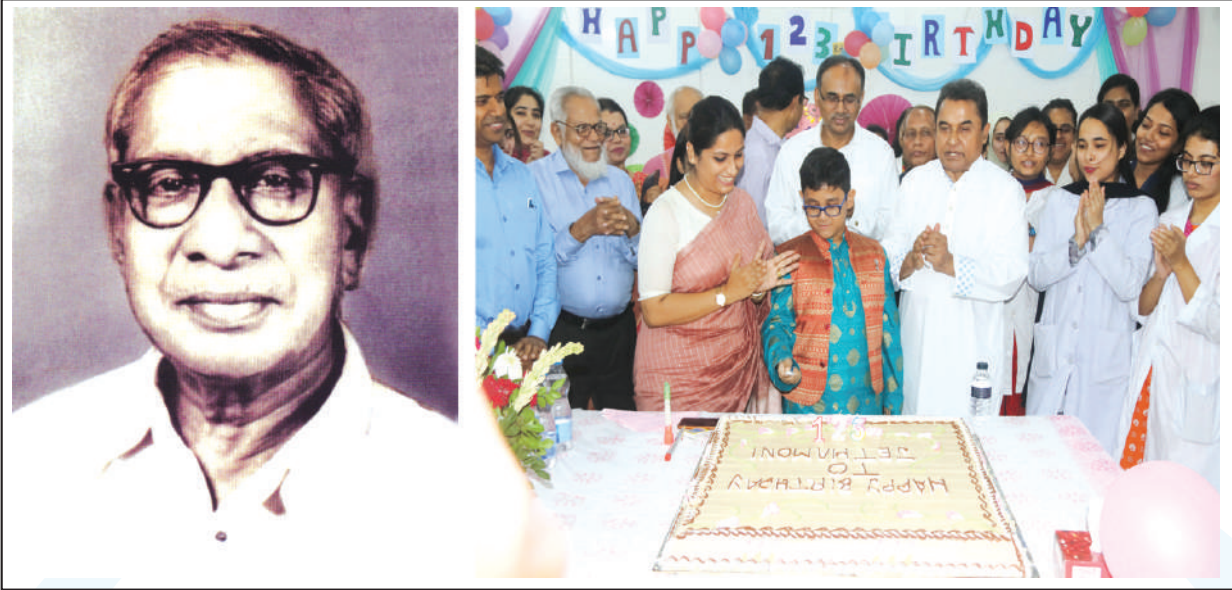
15 Nov, Kumudini Complex, Mirzapur : Celebration of 123rd Birth Anniversary of Philanthropist Ranada Prasad Shaha. The chief guest on the occasion was Finance Minister Mr AHM Mustafa Kamal, FCA, MP.

123rd Birth Anniversary of Philanthropist R P Shaha Observed