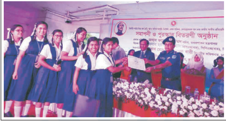
Students receiving prizes for their performance in the Victory Flower Competition at Bangladesh Shilpakala Academy in Dhaka.

Achievement of Bharateswari Homes at Victory Flower Competition