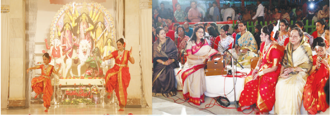
Durga Puja at R P Shaha's ancestral home and cultural programme in the evening at Mirzapur.

প্রতি বছরের মতো এবারও কুমুদিনী ওয়েলফেয়ার ট্রাস্টের প্রতিষ্ঠাতা রণদা প্রসাদ সাহা পৈতৃক নিবাসের ‘রণদা নাটমন্দির’ এ অনুষ্ঠিত হয়েছে শারদীয় দুর্গাপূজা। এবার ৩ অক্টোবরে দেবীর বোধনের মধ্য দিয়ে পূজার আনুষ্ঠানিকতা শুরু হয়ে ৮ অক্টোবর বিজয়া দশমী উদ্‌যাপনের মাধ্যমে অনুষ্ঠানের সমাপ্তি ঘটে।