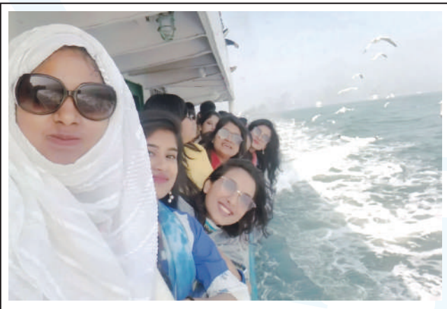
On the way to Saint Martins Island on board a ship.