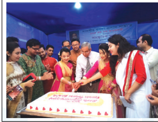
123rd Birth Anniversary of R P Shaha observed.

সবশেষে বিশ্ববিদ্যালয়ের ছাত্রছাত্রীদের অংশগ্রহণের মাধ্যমে পরিবেশিত হয় একটি মনোজ্ঞ সাংস্কৃতিক অনুষ্ঠান।