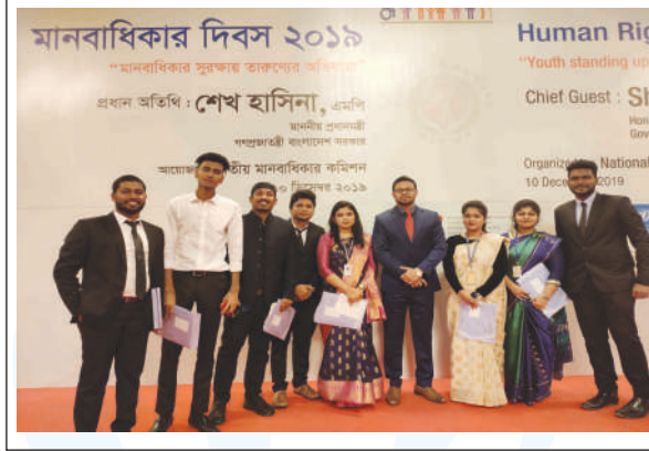
Participating teachers and students of Law & Human Rights Department of RPSU at a seminar on International Human Rights Day arranged at Pan-Pacific Sonargaon Hotel in Dhaka.

On 10 th December, a seminar on "International Human Rights Day" was held at Pan Pacific Sonargaon Hotel in Dhaka. The event was organized by "Bangladesh National Human Rights Commission". Students from the Dept of Law & Human Rights of RPSU participated in this seminar. Honorable Prime Minister Sheikh Hasina was the chief guest of the occasion. Law & Parliamentary Affairs Minister Anisul Haq and the Resident Coordinator of the United Nations Miah