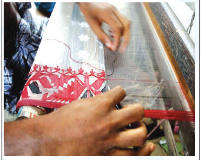
Weaving of Jamdani

On the occasion of Jamdani Festival an international delegation led by Dr. Ghada Hijjawi-Qaddumi visited Sonargaon Jamdani Palli on 5 September. The delegation included representatives from Kuwait, India, Thailand, Malaysia, UK, and Bangladesh. On completion of the trip at Sonargaon the delegation visited Kumudini Handicrafts at Narayanganj. ●