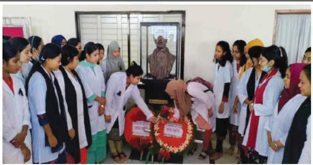
Students of KWMC placing floral wreath at the mural of Bangabandhu at the premises of the institute.