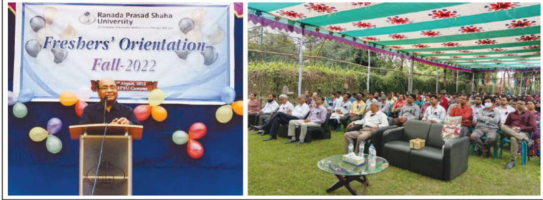
Freshers' Orientation programme for the students of Fall-2022 session.

গত ২৩শে আগস্ট বিশ্ববিদ্যালয় ক্যাম্পাসে অনুষ্ঠিত হয় 'ফল-২০২২' সেমেস্টারের শিক্ষার্থীদের নবীনবরণ অনুষ্ঠান।