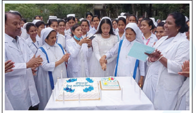
The Principal, Vice Principal and teachers of Kumudini Nursing College; Matron and Nursing staff of Kumudini Hospital are seen cutting cakes to observe the 201st birth anniversary of Florence Nightingale.