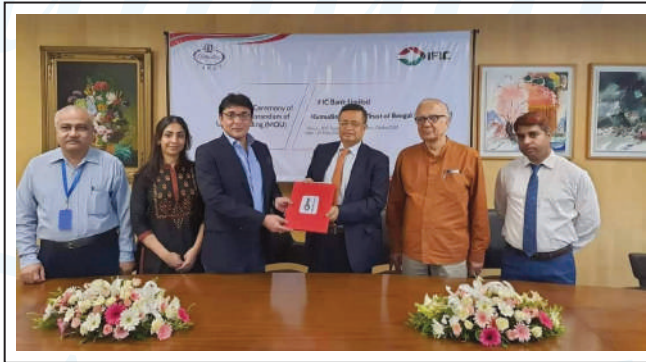
Following signing of the MoU the Managing Director of KWT and the CEO of IFIC Bank are seen exchanging documents.