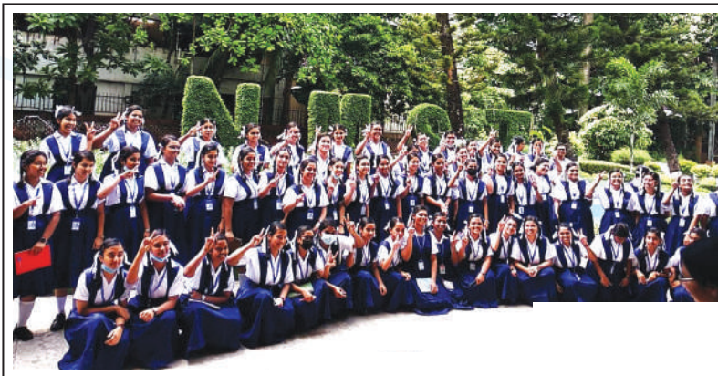
The participating students of Bharateswari Homes who went on a Study Tour to Dhaka.

মুজিবুর রহমান ও শহীদদের প্রতি শ্রদ্ধা জানিয়ে ‘তুমি বাঙলার ধ্রুবতারা’ শীর্ষক একটি গীতি আলেখ্য পরিবেশন করে এবং মুক্তিযুদ্ধ জাদুঘরের বিভিন্ন গ্যালারি ঘুরে ঘুরে দেখে। সেখানেও ছাত্রীদের জন্য একটি কুইজ প্রতিযোগিতা আয়োজন করা হয় এবং তারা পুরস্কৃত হয়। ●