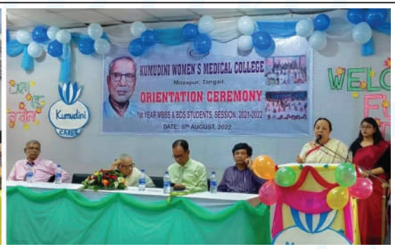
Orientation ceremony held for the new students of MBBS and BDS at B P Pati Hall of KWMC.

গত ৬ই আগস্ট কুমুদিনী উইমেন্স মেডিকেল কলেজের ২০২১-২০২২ সেশনের প্রথমবর্ষ এমবিবিএস ও বিডিএস ছাত্রীদের নবীনবরণ ও পরিচিতি অনুষ্ঠান কলেজের বি পি পতি হলে অনুষ্ঠিত হয়। এটি ছিল কলেজটির ২২তম এমবিবিএস ও ১১তম বিডিএস ছাত্রীদের পরিচিতি অনুষ্ঠান।