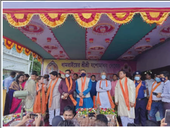
(L) On the eve of inauguration of the Rath Yatra hon'ble guests and members of the Sri Sri Yashomadhav Temple Management Committee are seen on the stage. (R) The Chariot (Rath) is being pulled by thousands of devotees to nearby Jatrabari Temple premises.