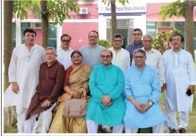
The visiting hon'ble judges of the Supreme Court at the university campus.