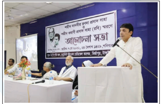
Discussion meeting at B P Pati Hall of KWMC.