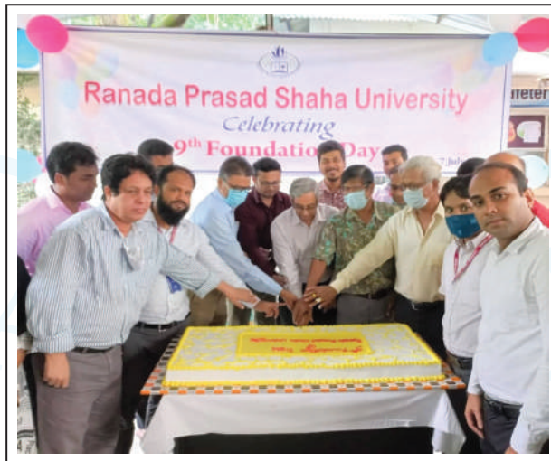
Ranada Prasad Shaha University (RPSU) celebrating its 9th Anniversary.