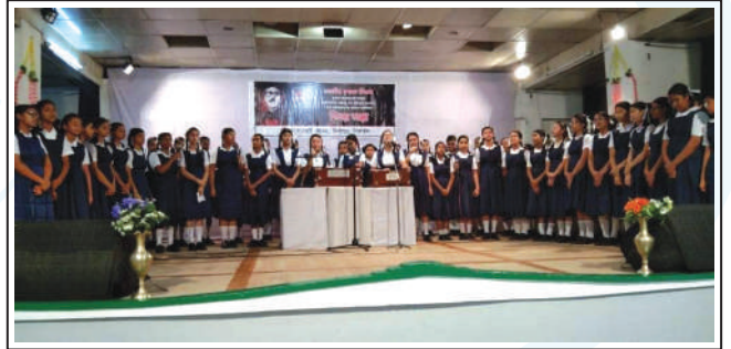
Students of Bharateswari Homes rendering songs to commemorate the National Mourning Day.