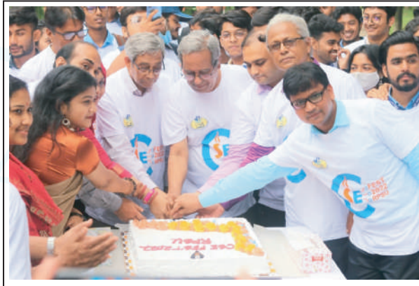
Inauguration of CSE Fest : 2022.