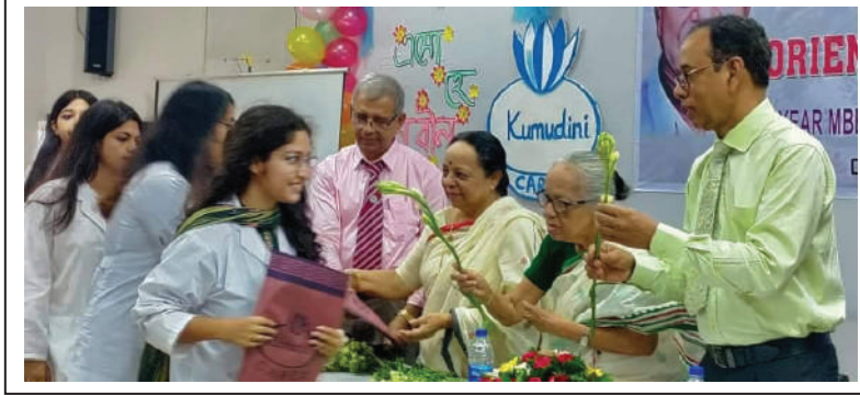
A total of 120 MBBS and 21 BDS Freshers were welcomed in the ceremony.