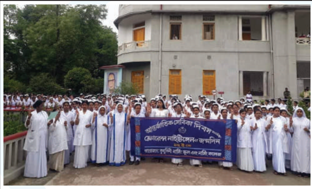
The Nursing staff and students at Kumudini Complex brought out a procession as a part of celebration of the International Nursing Day.

Here it is worth mentioning that Kumudini is a well-known name in the field of Nursing Education. Among the nursing courses taught here are: Diploma in Nursing Science and Midwifery; Diploma in Nursing Midwifery; Junior Diploma in Midwifery; BSc in Nursing; Diploma in Nursing; Specialised Nursing; MSc in Nursing and Caregiving Specialised Nursing under the auspices of the SEIP Project. All in all, there are now 958 students studying nursing in Kumudini. ●