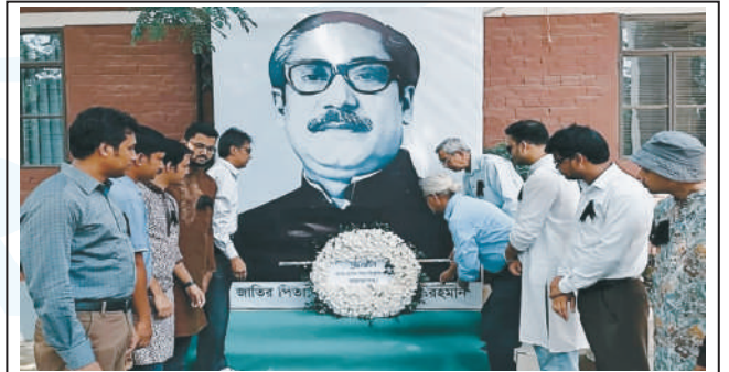
Teachers and students of RPSU placing floral wreath at the mural of the Father of the Nation in the campus.