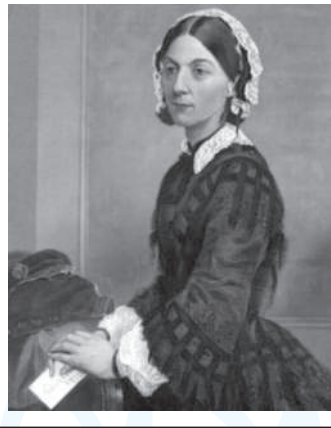
Florence Nightingale The Lady With The Lamp (12 May, 1820-13 August, 1910).

উল্লেখ্য, নার্সিং শিক্ষা ও প্রশিক্ষণের জন্য বাংলাদেশে কুমুদিনী একটি সুপরিচিত নাম। এখানে নার্সিং কোর্সগুলোর মধ্যে রয়েছে ডিপ্লোমা ইন নার্সিং সায়েন্স অ্যান্ড মিডওয়েফারি, ডিপ্লোমা ইন নার্সিং মিডওয়েফারি, জুনিয়র ইন মিডওয়েফারি, বিএসসি ইন নার্সিং, ডিপ্লোমা ইন নার্সিং, স্পেশালাইজড নার্সিং, এমএসসি ইন নার্সিং, সিপ (SEIP) প্রকল্পের আওতায় কেয়ারগিভিং স্পেশালাইজড নার্সিং কোর্স। এসব কোর্সে শিক্ষার্থীর সংখ্যা ৯৫৮ জন। ●