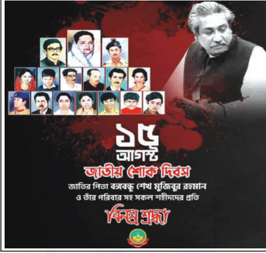
Father of the Nation Bangabandhu Sheikh Mujibur Rahman and his martyred family members.

জাতীয় শোক দিবসে শিক্ষার্থী ও শিক্ষকদের অংশগ্রহণে অনুরূপ কর্মসূচি পালিত হয় নারায়ণগঞ্জে রণদা প্রসাদ সাহা বিশ্ববিদ্যালয়ে। ●