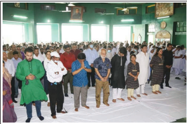
Prayer at Ananda Niketon Auditorium.