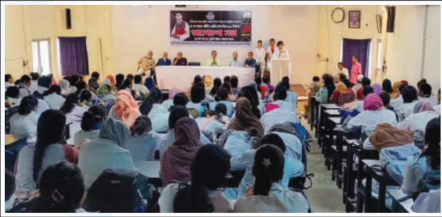
Discussion meeting at Kumudini Women's Medical College.

A similar event was also held in the Ranada Prasad Shaha University (RPSU) campus in Narayanganj. ●