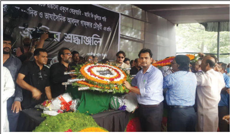
Floral wreath is being placed on his coffin at Central Shaheed Minar on behalf of Kumudini Welfare Trust.