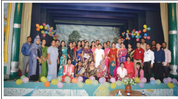
After successful completion of training at Kumudini the students of Batch-1 and Batch-2 of caregiving course accorded Farewell reception with certificates.

এশীয় উন্নয়ন ব্যাংকের ঋণ সহায়তায় কোর্সগুলো পরিচালিত হচ্ছে। ●