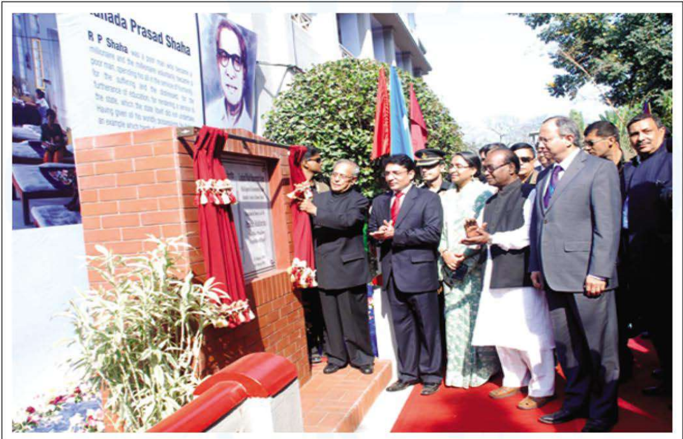
Shri Pranab Mukherjee, the Hon'ble President of India, unveiling foundation stone of the Combined Waste Management System Project at Kumudini Complex, Mirzapur. – 5 March, 2013

On conclusion of the reception hosted in his honour at Bharateswari Homes, Hon'ble Shri Pranab Mukherjee unveiled the foundation stone of the Combined Waste Management System. ●