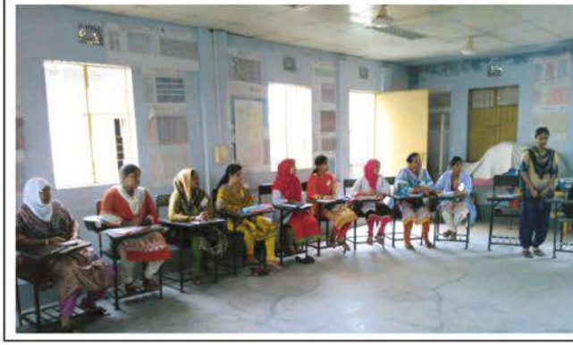
Nurses, paramedics and assistants from 13 garments factories undergoing training in Kumudini Hospital.