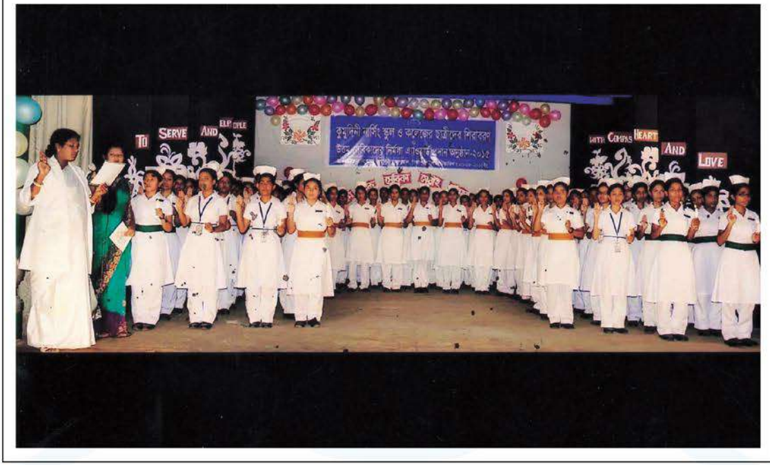
Oath taking by the student nurses after capping ceremony.