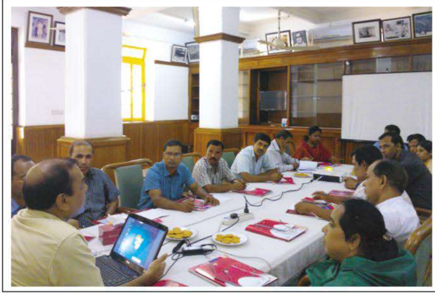
Participating Managers of 'Surjer Hashi Clinic' in the workshop.

গত ৫ আগস্ট ফিস্টুলা কেয়ার প্রকল্পের প্রসারণকল্পে কুমুদিনী ও দাতা সংস্থা এনজেন্ডার হেলথ-এর যৌথ উদ্যোগে কুমুদিনী হাসপাতালে একটি সচেতনতামূলক ওয়ার্কশপের আয়োজন করা হয়। এতে অংশ নেন টাংগাইল জেলায় অবস্থিত 'সূর্যের হাসি ক্লিনিক' সমূহের ১৫ জন ম্যানেজার।