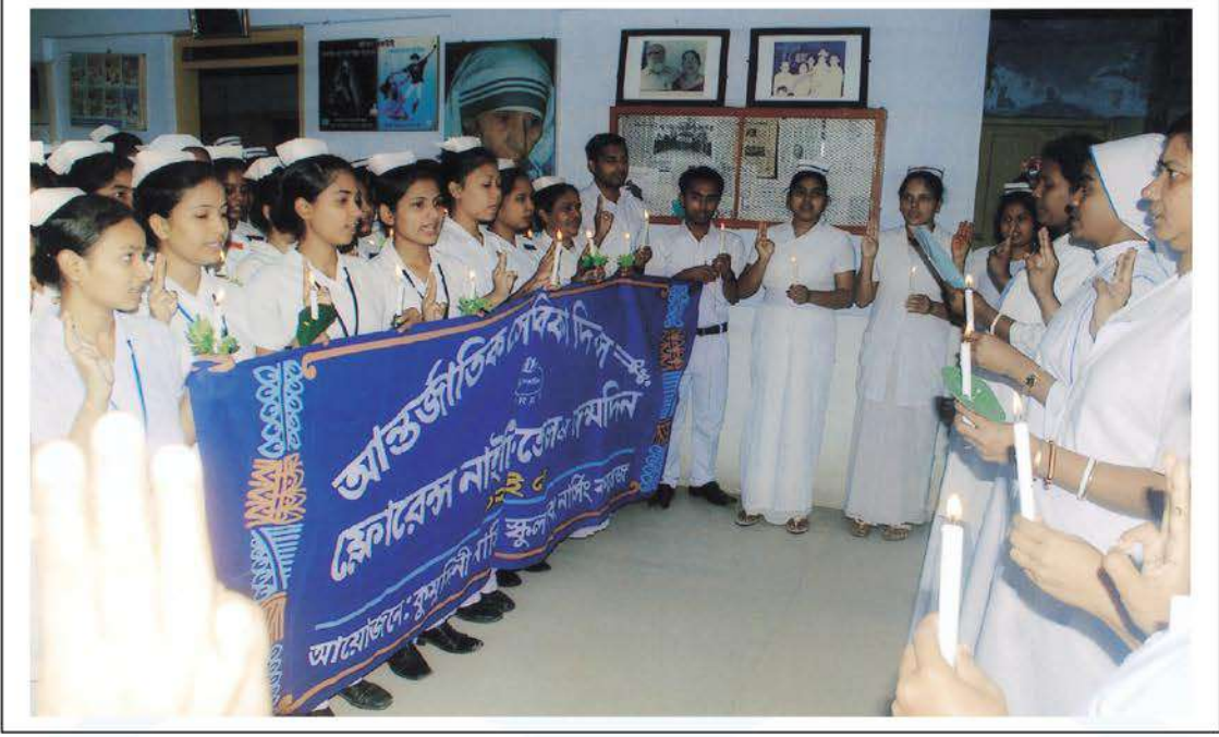
The nurses taking oath on the Int'l Nurses Day.

গত ১২ মে কুমুদিনী নার্সিং স্কুল ও কলেজের উদ্যোগে আধুনিক নার্সিংয়ের পথিকৃত ফ্লোরেন্স নাইটিংগেলের জন্মদিনটি 'আন্তর্জাতিক সেবিকা দিবস' হিসেবে পালন করা হয়। এ বছর দিবসটির মূল প্রতিপাদ্য বিষয় ছিল 'নার্স: পরিবর্তনের এক সহায়ক শক্তি-ব্যয়সাশ্রয়ী কার্যকর সেবা প্রদানের ক্ষেত্রে'। এবার ছিল নাইটিংগেলের ১৯৫তম জন্ম বার্ষিকী।