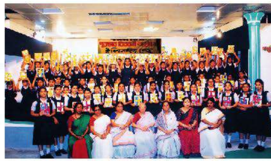
The prize winning students of Bishwa Sahitya Kendro's Book Reading Programme.