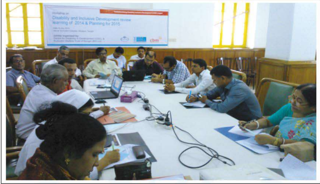
Workshop on Disability and Inclusive Development.