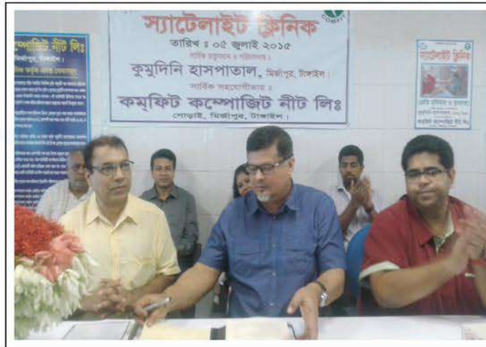
An MoU signed between Kumudini Hospital and Comfit Composite Nit Ltd to conduct a Satellite Clinic at the factory.

Gorai near Mirzapur. As per the MoU signed between KWT and the garments factory Kumudini will provide health services to the workers of the factory two days a week on Sunday and Wednesday. A team comprising of a doctor and nurses from Kumudini Hospital will run the clinic. The health services would include treatment, diagnosis, pathological test etc. •