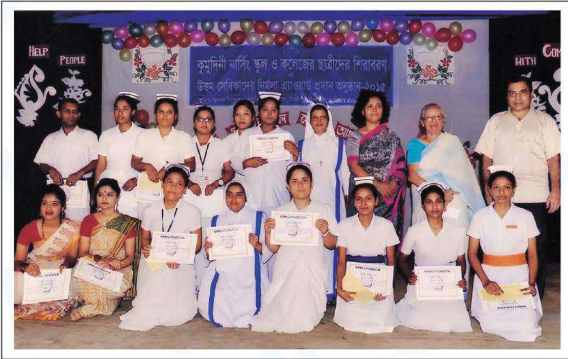
The recipients of Nirmala Award-2015 with the chief guest and high officials.