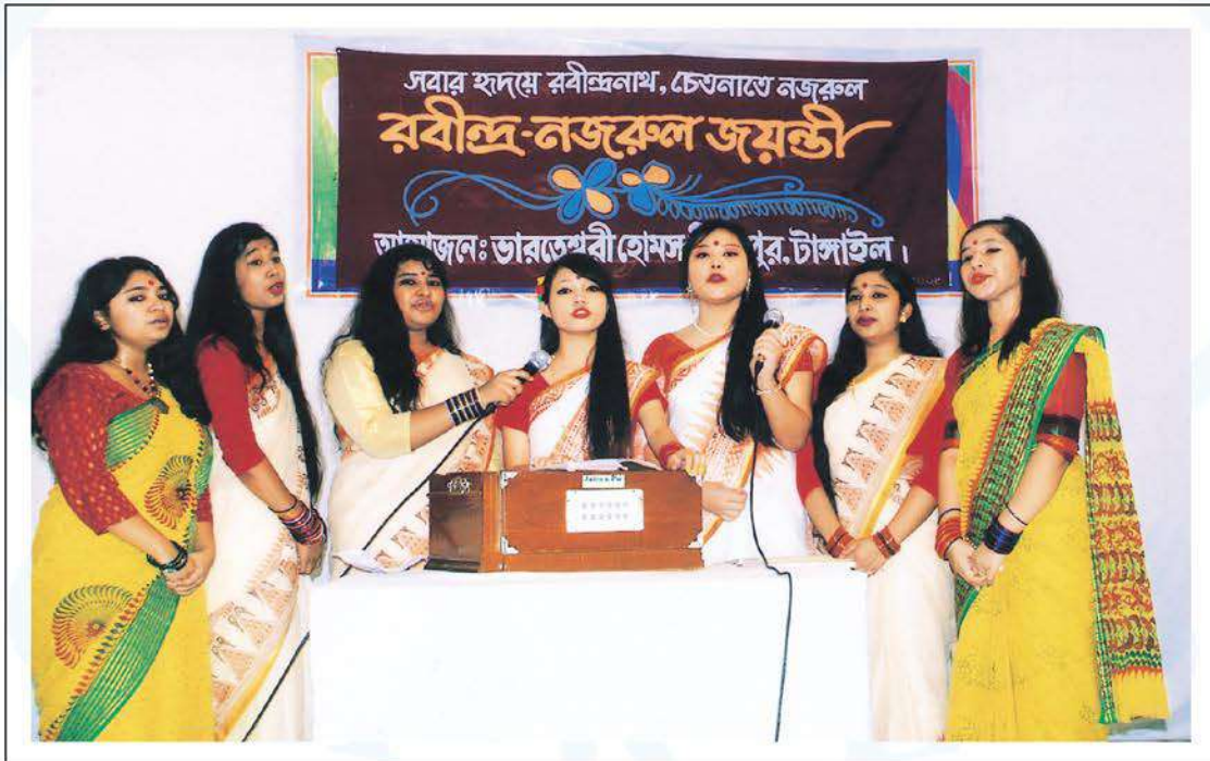
The observance of Rabindra-Nazrul birth anniversary at Bharateswari Homes. Students of the institution are seen rendering songs. – Mirzapur, 20 June, 2015