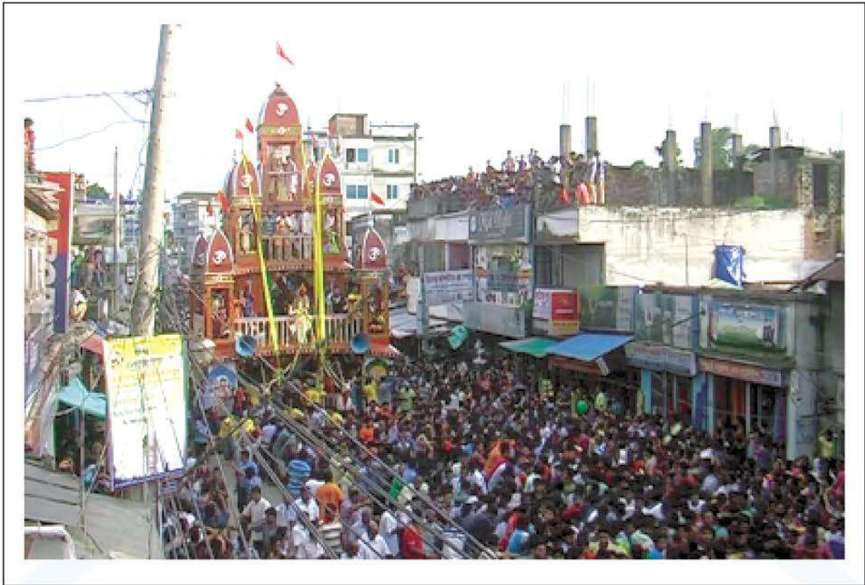
Rathayatra Festival of Shri Shri Yashomadhaba at Dhamrai. – 18 July, 2015.