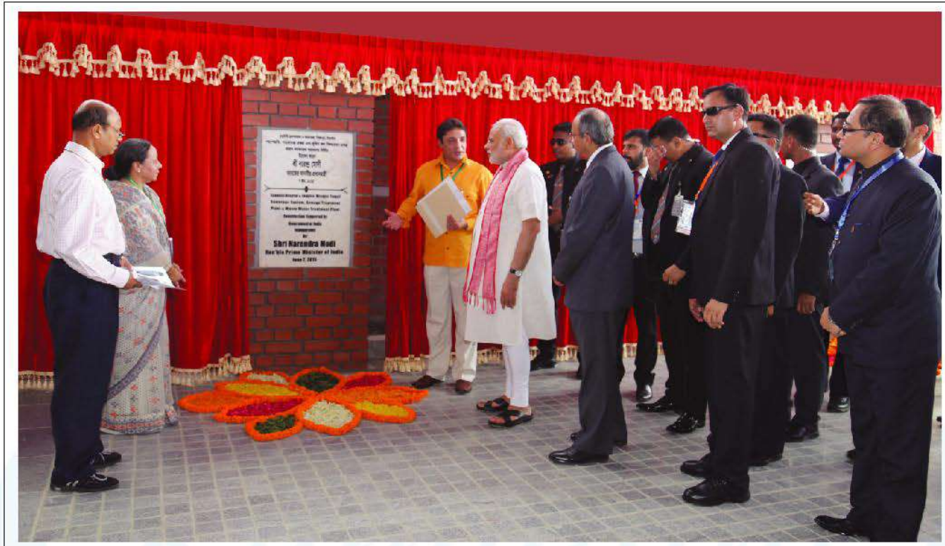
Shri Narendra Modi, the Hon'ble Prime Minister of India, inaugurating the newly constructed Combined Waste Management System of Kumudini Complex funded by the Govt. of India.

PM of India Inaugurates The Combined Waste Management System of Kumudini