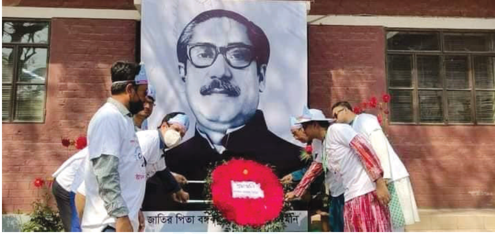
Floral Wreath is being placed at the image of the Father of the Nation Bangabandhu Sheikh Mujibur Rahman on his 102 th birth anniversary at RPSU.