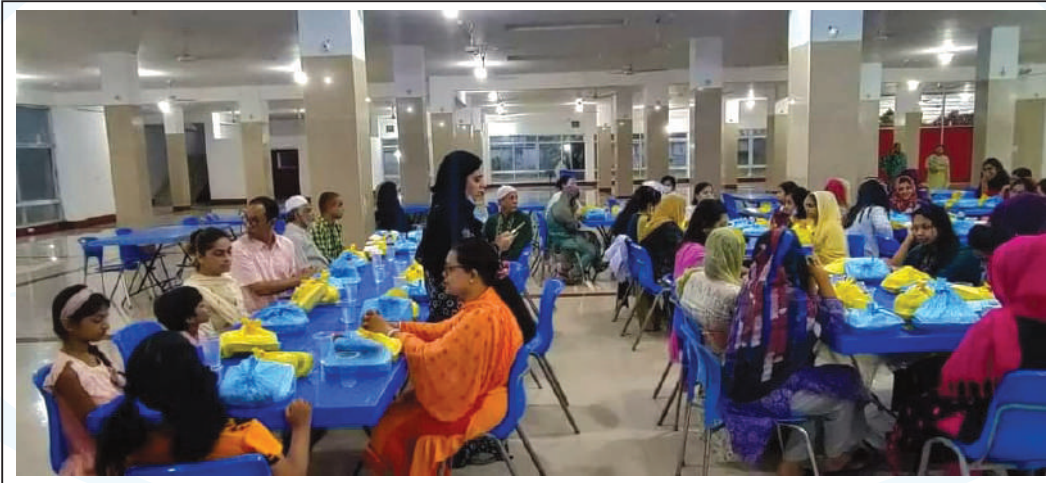
Iftar Party arranged at Kumudini Hospital.

গত ১৯শে এপ্রিল রণদা প্রসাদ সাহা বিশ্ববিদ্যালয় ক্যাম্পাসে পবিত্র রমজান উপলক্ষ্যে বিশ্ববিদ্যালয়ের শিক্ষার্থীদের উদ্যোগে ইফতার মাহফিলের আয়োজন করা হয়। এতে বিশ্ববিদ্যালয়ের তিন শতাধিক শিক্ষার্থী ও শিক্ষক অংশগ্রহণ করেন। পক্ষান্তরে, কুমুদিনী হাসপাতালে ইফতার মাহফিলের আয়োজন করা হয় গত ২৯শে এপ্রিল পবিত্র শবে কদরের দিন। এতে অংশ নেন হাসপাতালের ডাক্তার, ইন্টার্ন ডাক্তার, সেবিকা ও সংশ্লিষ্ট ব্যক্তিবর্গ। ●