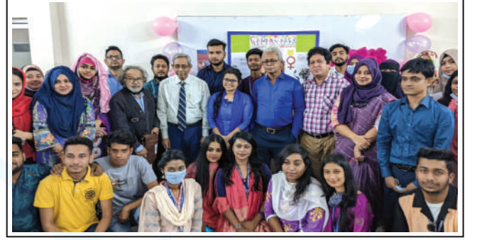
Observance of International Women's Day at RPSU, Narayanganj.