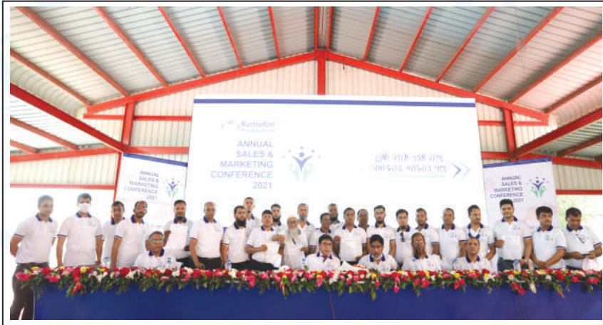
Winners of Performance Award : 2021 with the top management of KPL.