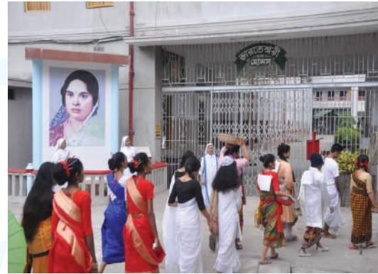
Celebration of Bengali New Year : 1429 at Mirzapur Kumudini Complex.