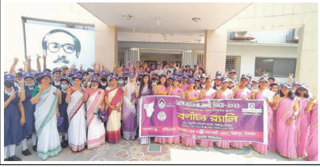
A colourful rally was organised on the occasion of IWD at Kumudini Complex.

In Bangladesh, women hold positions as Judges, Secretaries to the Government, Officers in the Armed Forces and in the Private Sector. In the area of self-employment too, the women of Bangladesh have created history.