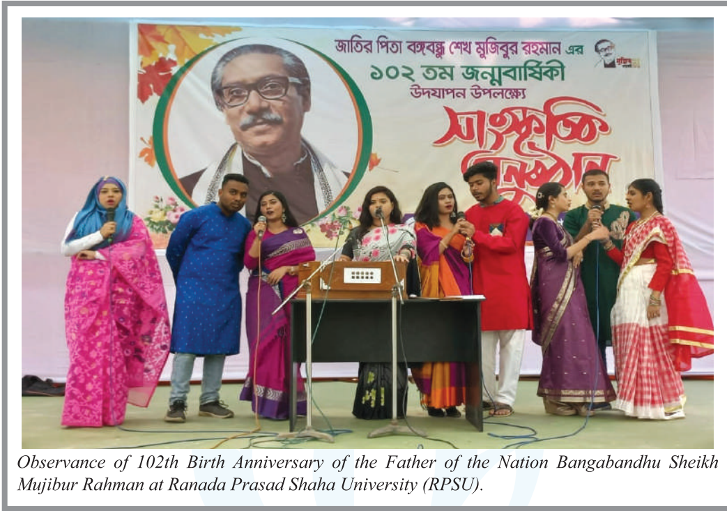
Observance of 102th Birth Anniversary of the Father of the Nation Bangabandhu Sheikh Mujibur Rahman at Ranada Prasad Shaha University (RPSU).