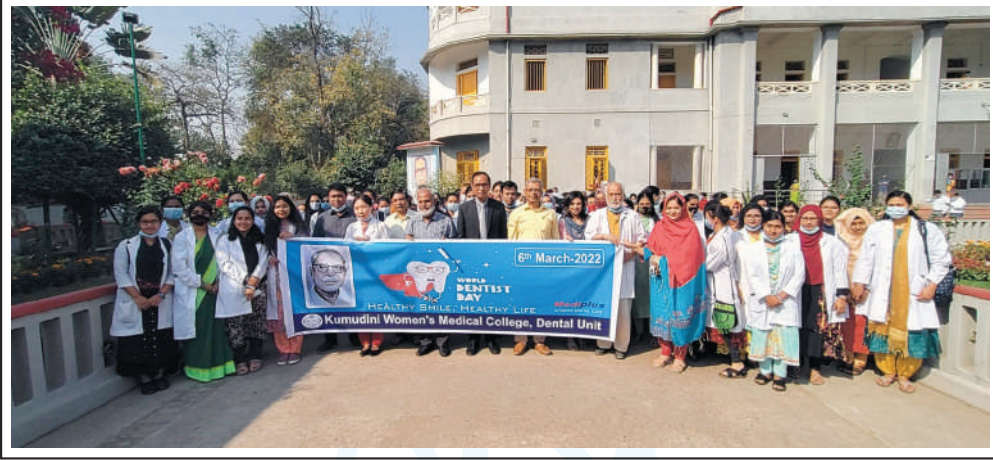
A colourful rally by students and teachers of KWMC on World Dentist Day.

গত ৬ মার্চ ওয়ার্ল্ড ডেন্টিস্ট দিবস : ২০২২ উপলক্ষে কুমুদিনী উইমেন্স মেডিকেল কলেজ ও ডেন্টাল ইউনিট আনন্দ র্যালি ও আলোচনা সভার আয়োজন করে।