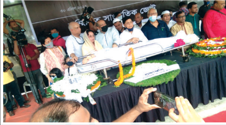
Placing floral wreaths on the coffin of former Finance Minister Abul Maal Abdul Muhit on behalf of Kumudini Welfare Trust at Central Shaheed Minar.

উল্লেখ্য, ২০১৮ সালের ১৭ই মার্চ বাংলাদেশ সরকারের অর্থমন্ত্রী থাকাকালে তিনি মির্জাপুর কুমুদিনী কমপ্লেক্স পরিদর্শন করেন এবং কুমুদিনী হাসপাতালের নিবিড় পরিচর্যা কেন্দ্র বা ইনটেনসিভ কেয়ার ইউনিট (আইসিইউ)-এর উদ্বোধন করেন। ●