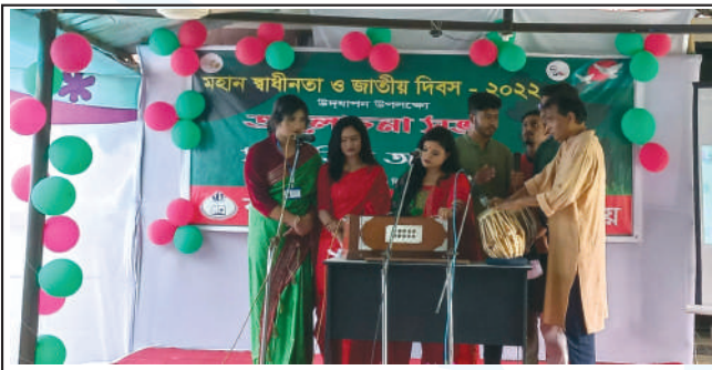
Students of RPSU performing patriotic songs in observance of the Independence Day.

এই উপলক্ষ্যে মুক্তিযুদ্ধের মহান শহীদদের স্মরণে ফুলেল শ্রদ্ধা জ্ঞাপন করা হয়। এই সময় উপস্থিত ছিলেন বিশ্ববিদ্যালয়ের উপাচার্য, শিক্ষকবৃন্দ, শিক্ষার্থী ও কর্মকর্তাবৃন্দ। বিশ্ববিদ্যালয় ক্যাম্পাসে এই উপলক্ষ্যে ছাত্র-ছাত্রীদের অংশগ্রহণে একটি মনোজ্ঞ সাংস্কৃতিক অনুষ্ঠানের আয়োজন করা হয়। ●