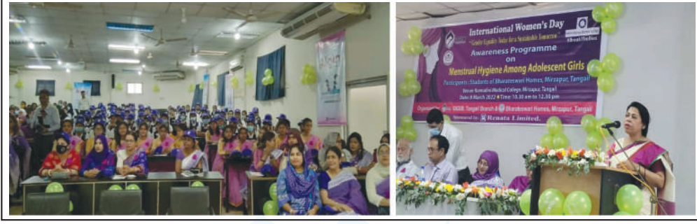
Discussion Programme on International Women's Day at Mirzapur KWT Complex.

৮ মার্চ ছিল আন্তর্জাতিক নারী দিবস। অর্থনৈতিক, সামাজিক, রাজনৈতিকসহ উন্নয়নের সর্বক্ষেত্রে নারীর সমান অংশীদারিত্ব এবং সম-অধিকার প্রতিষ্ঠার লক্ষ্যে বিশ্বের অন্যান্য দেশের মতো বাংলাদেশেও সরকারি ও বেসরকারিভাবে যথাযোগ্য মর্যাদায় দিবসটি পালিত হয়েছে। এ উপলক্ষ্যে অবস্টেট্রিক্যাল অ্যান্ড গাইনোকলজিক্যাল সোসাইটি অব বাংলাদেশ হাসপাতাল (ওজিএসবি) টাঙ্গাইল শাখা, কুমুদিনী উইমেন্স মেডিকেল কলেজ এবং ভারতেশ্বরী হোমস যৌথভাবে বর্ণাঢ্য আনন্দ র্যালি, আলোচনা সভা ও সাংস্কৃতিক অনুষ্ঠানের আয়োজন করে কুমুদিনী ক্যাম্পাসে।