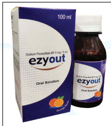
ezyout oral solution.

কুমুদিনী ফার্মা লি: (কেপিএল) সম্প্রতি ইজি আউট নামে একটি নতুন ওষুধ বাজারজাত করেছে। এটি একটি ওরাল সলিউশন। পুরাতন বা দীর্ঘস্থায়ী কোষ্ঠকাঠিন্যসহ যে কোনো কারণে সৃষ্ট সকল প্রকার কোষ্ঠকাঠিন্য প্রতিকারে এটি নির্দেশিত এবং নির্দেশিত মাত্রায় সেব্য। ইজি আউটের প্রতি বোতলে ১০০ মি. লি. ওরাল সলিউশন এবং সাথে একটি পরিমাপক কাপ থাকে। ●