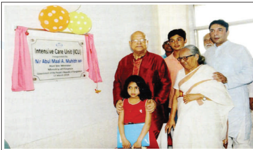
18 March 2018, Mirzapur : Inauguration of ICU at Kumudini Hospital by the then Finance Minister Mr A M A Muhit.

Here, it may be mentioned that on 17 th March, 2018, Mr A M A Muhit visited Kumudini Complex, Mirzapur as Finance Minister. During this visit, he toured the entire complex and Inaugurated the Intensive Care Unit (ICU) at Kumudini Hospital. ●