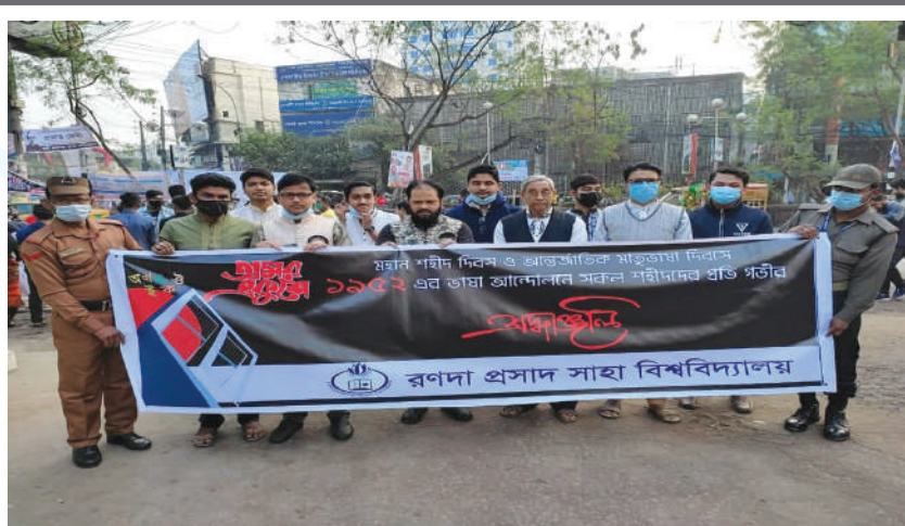
Students and teachers of RPSU marching forward with a banner to pay respect to the language movement martyrs of 21st February.

Here, it may be mentioned that the students of Bharateswari Homes have been participating in this event since 2017. ●