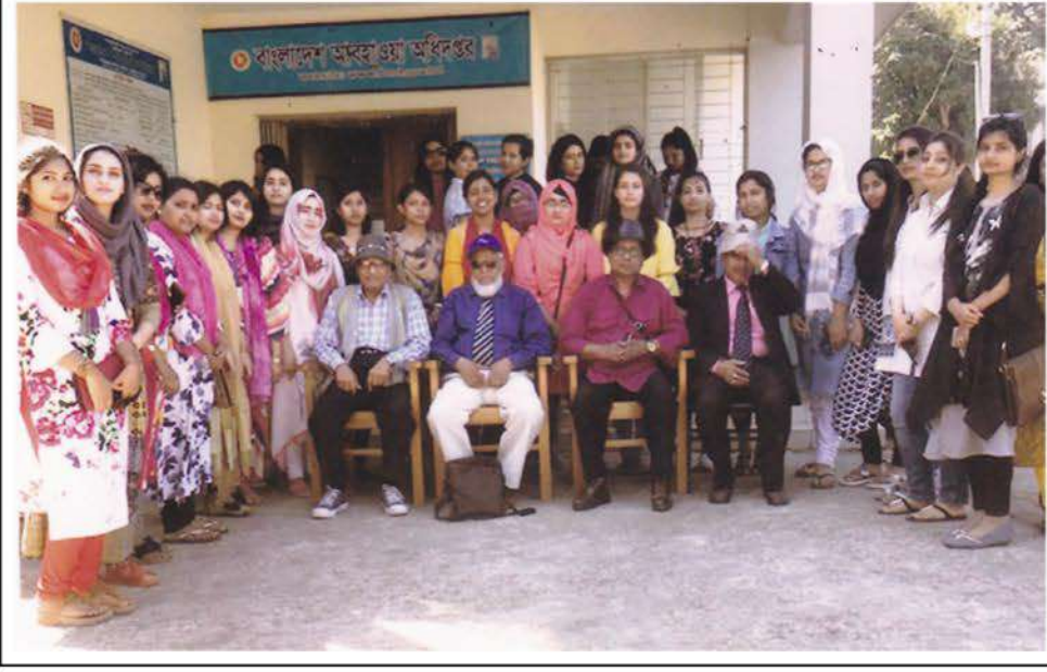
3rd year MBBS students of KWMC visited Weather Observation Centre at Cox's Bazar.

Study Tour of MBBS Third Year Students of Kumudini Women's Medical College