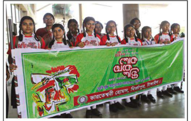
Students of Bharateswari Homes participating in a walking programme entitled 'Tragedy To Power' in the street of Dhaka as a part of Independence Day observation.