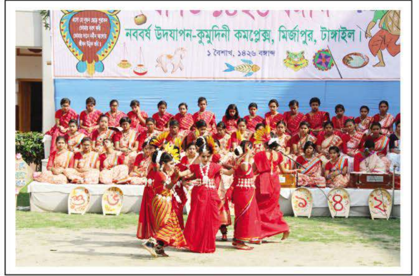
Bengali New Year 1426 celebration.

The first day of Bengali New Year 1426 was observed with pomp and grandeur at various units of Kumidini Complex. The students of Bharateswari Homes participated in a day-long programme in the campus. The events included a blood donation camp, procession, unveiling of annual magazine kakali and a wall magazine and presentation of cultural programmes. ●