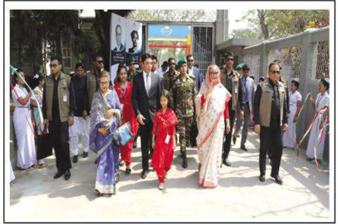
PM welcomed by the students of Kumudini Nursing School and College.