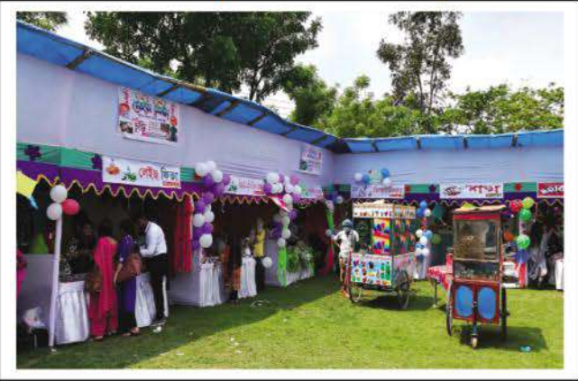
A dozen of stalls set up in the campus.