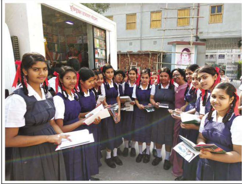
Students of Bharateswari Homes purchasing books on liberation war from a mobile library of Shrabani Prakashani from Dhaka which travelled to Kumudini Complex on the eve of 21st February.

ভারতেশ্বরী হোমস প্রাঙ্গণে অতীতে বিচিত্র বই নিয়ে বিশ্বসাহিত্য কেন্দ্রের ভ্রাম্যমাণ লাইব্রেরি আসার নজির রয়েছে কিন্তু শুধুমাত্র মুক্তিযুদ্ধভিত্তিক বইয়ের পসরা নিয়ে ভ্রাম্যমাণ লাইব্রেরি কিংবা বইয়ের মেলা এই প্রথম। ছাত্রীরা প্রথমবারের মতো এই ধরনের বইমেলা দেখে অভিভূত।