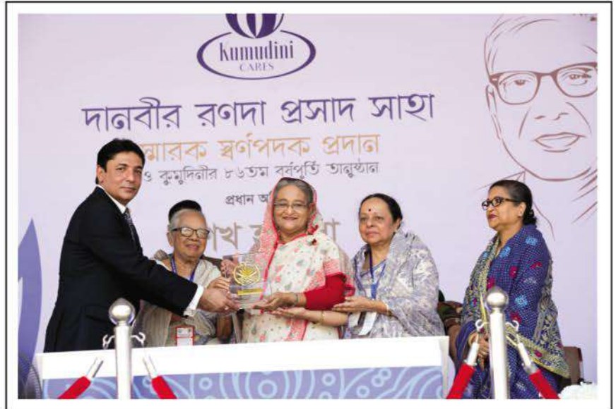
PM handing over a crest to Kumudini Welfare Trust.