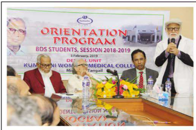
Orientation Programme of BDS students for 2018-2019 Session.

The students participated in the above study tour with great enthusiasm and gathered first-hand experience. ●