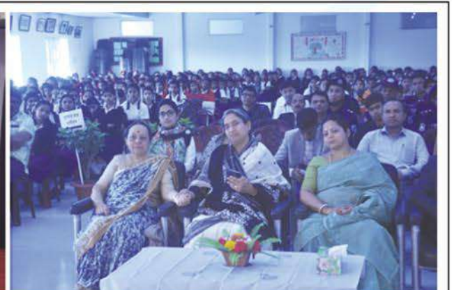
Education Minister Dr Dipu Moni at a cultural programme organized by students of Bharateswari Homes.