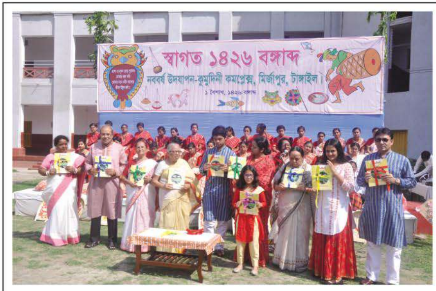
Unveiling of annual magazine 'Kakali' on Bengali New Years Day.