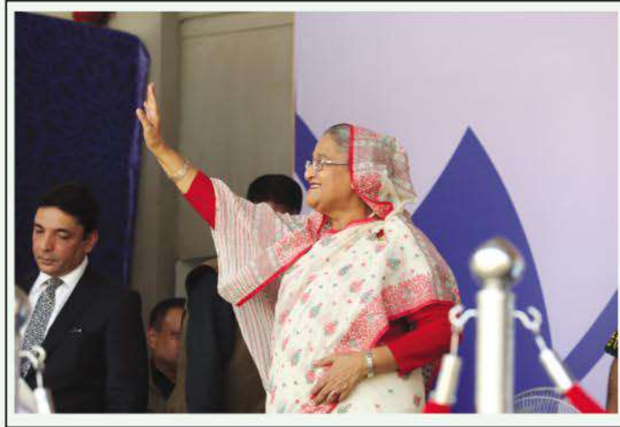
Sheikh Hasina waving to the audience from dais.