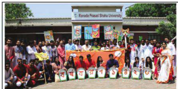
Observance of Bengali New Year 1426