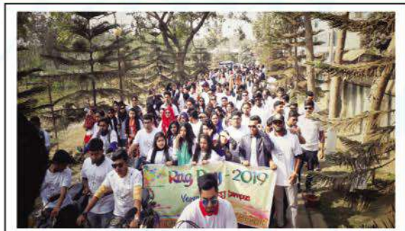
Students of RPSU observing delightful Rag Day 2019