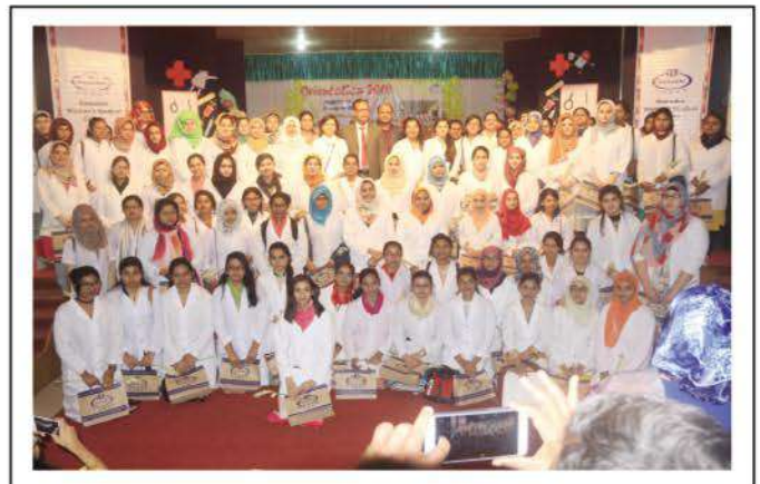
Freshers of MBBS Course for 2018-2019 Session.