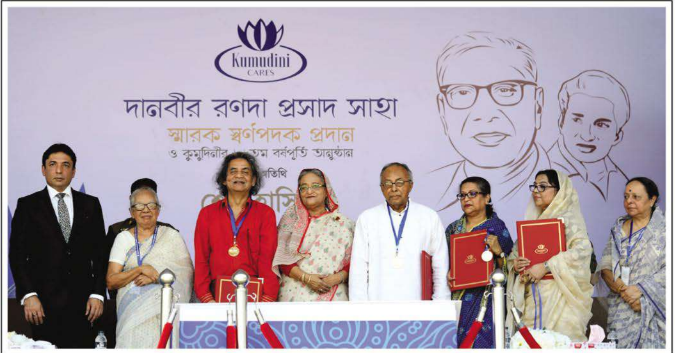
Prime Minister Sheikh Hasina with recipients of 'Philanthropist Ranada Prasad Shaha Memorial Gold Medal' at Kumudini Complex, Mirzapur on the occasion of 86th founding anniversary of Kumudini Welfare Trust.

Prime Minister awards R P Shaha Memorial Gold Medal to 4 prominent personalities