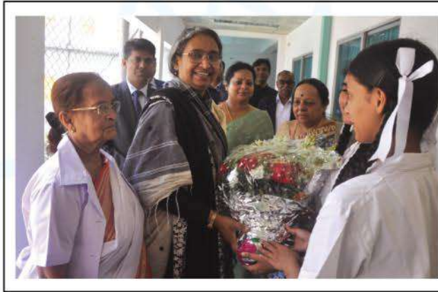
Education Minister Dr Dipu Moni being received at Bharateswari Homes.

Minister visited different institutions in the Kumudini Complex before attending the Prize Distribution Ceremony. She was received by the members of student union of Bharateswari Homes when came to their institution. At the end of the ceremony, the students of the school arranged a cultural function. ●