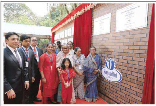
PM unveiled plaques of two projects of KWT : Bharateswari Homes Multipurpose Hall and Institute of Post Graduate Nursing Complex.