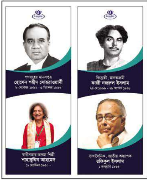
Recipients of Philanthropist Ranada Prasad Shaha Memorial Gold Medal.