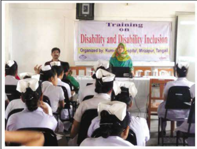
Training on Disability and Disability Inclusion.