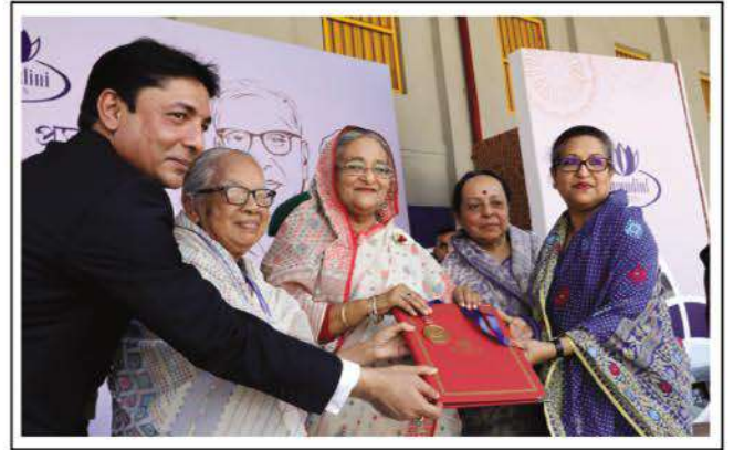
Sheikh Rehana, youngest daughter of the Father of the Nation Bangabandhu Sheikh Mujibur Rahaman, receiving Gold Medal from the PM on behalf of Huseyn Shaheed Suhrawardy.

Prime Minister arrived at the Kumudini Complex, Mirzapur, by helicopter at 11 am. She was presented with a guard of honour by the local district Police Administration. On entering the Hospital Complex, the Prime Minister was welcomed by students of Kumudini Nursing School & College. Thereafter, the Prime Minister unveiled the two plaques of Kumudini (namely Bharateswari Homes Multipurpose Hall and Institute of Post Graduate Nursing Complex) as well as 17 plaques of government projects in Tangail District.