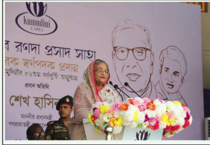
Speech by Prime Minister Sheikh Hasina. She urged the affluent people of Bangladesh to come forward for the welfare of distressed people following the example set by Danabir Ranada Prasad Shaha.

আমি এটুকুই আপনাদের বলতে চাই যে, রণদা প্রসাদ সাহা বিশ্ববিদ্যালয়, কুমুদিনী নার্সিং স্কুল এন্ড কলেজ, কুমুদিনী উইমেন্স মেডিকেল কলেজ এবং মানুষের কল্যাণে প্রতিষ্ঠিত কুমুদিনী ট্রেনিং ইন্সটিটিউট চালু আছে। (পোস্ট গ্রেজুয়েট নার্সিং ট্রেনিং ইন্সটিটিউট) এটাও তারা চালু করতে যাচ্ছে সেজন্য আমি ধন্যবাদ জানাই। আমি সত্যিই আনন্দিত যে আমি আজকে এখানে এসেছি—সবচেয়ে বড় কথা স্কুলের (ভারতেশ্বরী হোমসের) মেয়েরা চমৎকার ডিসপ্লে করেছে, যদিও সবসময় আমরা দেখি কারণ আমাদের স্বাধীনতা দিবসেও কুমুদিনী সবসময়ই এক নম্বরে থাকে এবং পুরস্কারটা তারাই বেশি পায়। (তাদেরকে) আমার অভিনন্দন। আর আজকেও খুব চমৎকারভাবে যে ডিসপ্লেটা আমাদের মেয়েরা দেখালো তার জন্য তাদেরকে আমি আন্তরিক অভিনন্দন জানাচ্ছি এবং বিশ্ববিদ্যালয়, স্কুল কলেজ, নার্সিং কলেজ, ট্রেনিং ইন্সটিটিউটের সকল