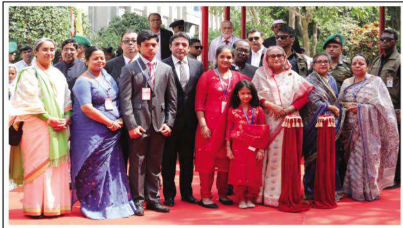
PM Sheikh Hasina, her younger sister Sheikh Rehana, Education Minister Dr Dipu Moni with dignitaries of KWT.