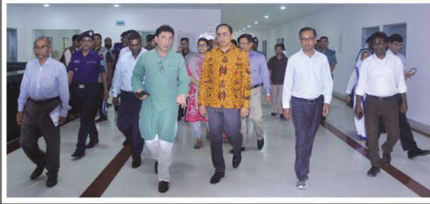
IG of Police Dr Mahmmad Javed Patwary visiting Kumudini Complex at Mirzapur.

গত ৫ এপ্রিল পুলিশের মহাপরিদর্শক (আইজিপি) ডক্টর মোহাম্মদ জাবেদ পাটোয়ারী মির্জাপুরে কুমুদিনী কমপ্লেক্স পরিদর্শনে যান। ঐদিন বিকেলে কুমুদিনী হাসপাতাল লাইব্রেরিতে পৌঁছালে হাসপাতালের ডাক্তার ও নার্সগণ তাকে ফুল দিয়ে শুভেচ্ছা জানান।