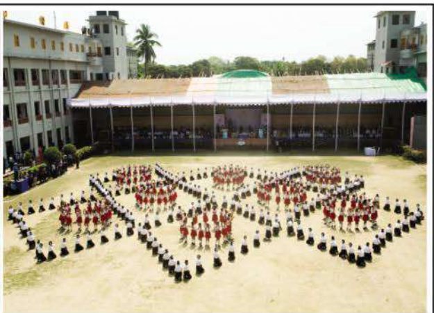
PM Sheikh Hasina witnessing drill performances by students of Bharateswari Homes.