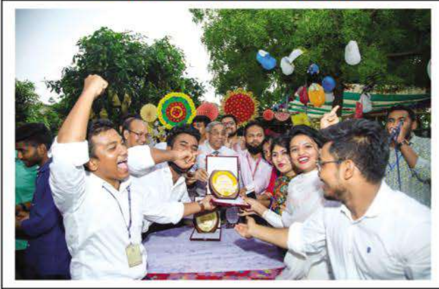
Students who got prizes cheering at their success.

গত ১৩ এপ্রিল বিশ্ববিদ্যালয়ের ব্যবসা প্রশাসন বিভাগের ক্যারিয়ার ডেভেলপমেন্ট সেন্টার (সিডিসি)-এর আয়োজনে 'উদ্যোক্তা দিবস : ২০১৯' উদ্‌যাপিত হয়। এতে ব্যবসা প্রশাসনের সকল শিক্ষক ও শিক্ষার্থী অংশগ্রহণ করেন।